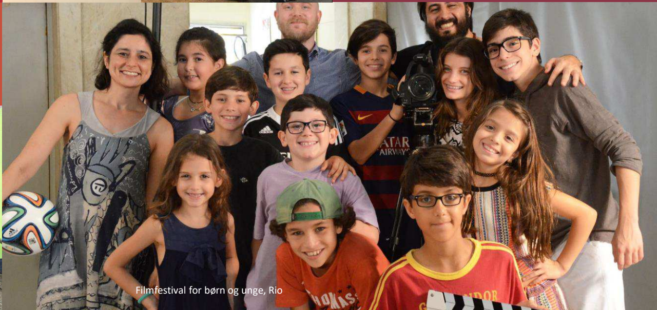
Filmfestival for børn og unge, Rio