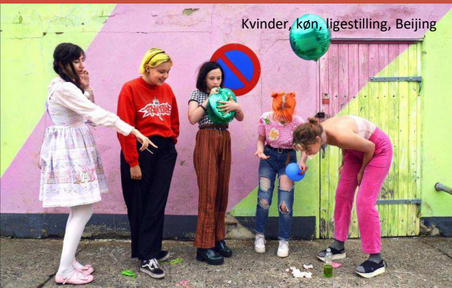
Kvinder, køn, ligestilling, Beijing

At bringe udsyn og viden om verden til Danmark.