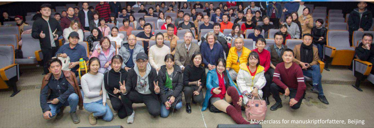
Masterclass for manuskriptforfattere, Beijing