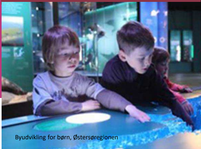
Byudvikling for børn, Østersøregionen