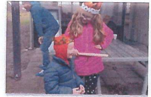
Fastelavn på veteranhjem

Vi deler erfaringer med hinanden om hvor man kan søge hvilken hjælp, og vi bidrager konstruktivt i den offentlige debat om vilkårene for familier hvor far har taget skade af at deltage i krig.