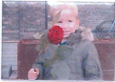
Min far er veteran