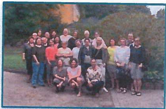
Netværksmøde i Korsør, august 2017