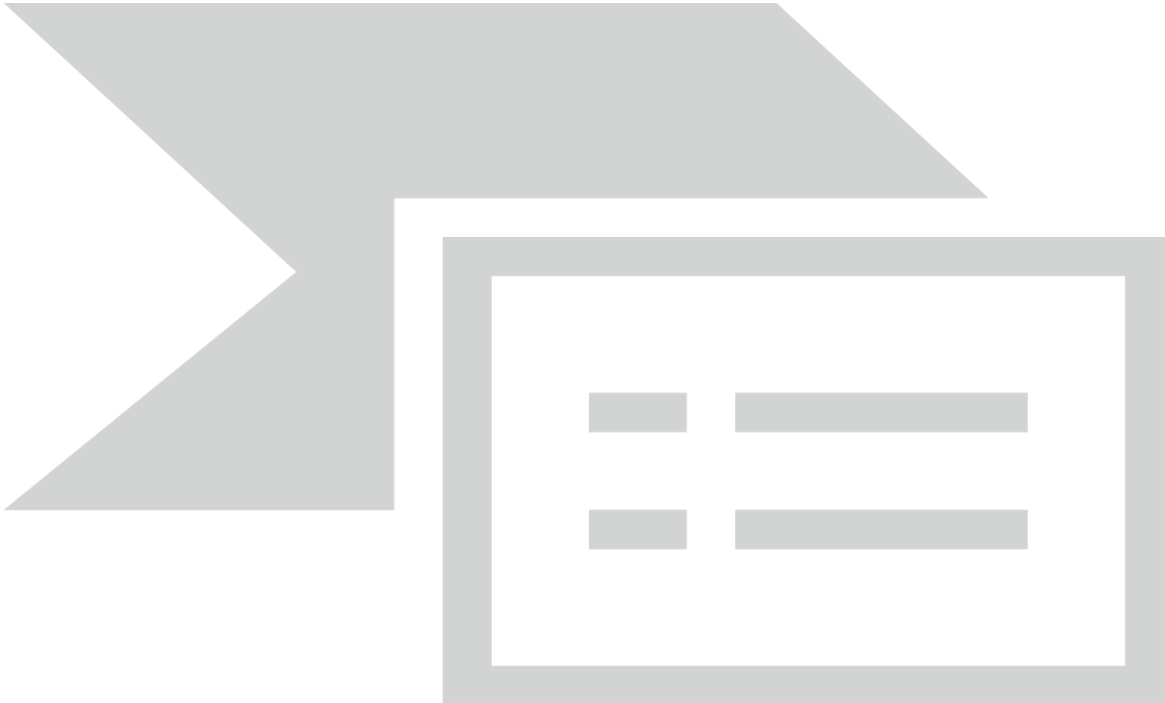
Figur 3: Fordelingen af afvikling ift. de strategiske teknologiområder i den forsvarsindustrielle strategi (mio. kr.)

Note: Den forsvarsindustrielle strategi indeholder i alt 8 strategiske teknologiområder. Området 'Dele af det maritime område med kritisk betydning for militære operationer' er der endnu ikke afviklet på, og det fremgår derfor ikke af figuren.