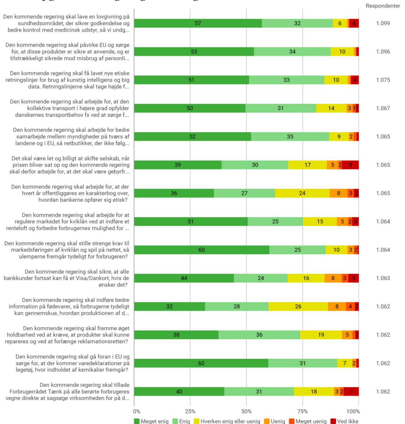
Figur 1 – Alle N = 1062