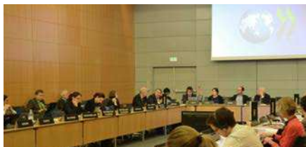
Working Party on Environmental Performance (miljøindsatsarbejdsgruppen)

Alle OECD's medlemslande og Europa-Kommissionen er repræsenteret i Working Party on Environmental Performance (miljøindsatsarbejdsgruppen). Evalueringens afsnit om vurdering og anbefalinger godkendes af arbejdsgruppen. Rapporten offentliggøres under OECD's generalsekretærs ansvar.