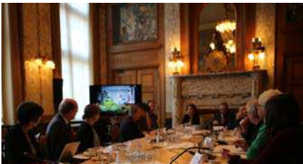
Evalueringsmission i Rotterdam, Nederlandene, 2015