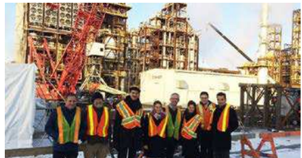
Feltbesøg i Edmonton, Canada, 2017