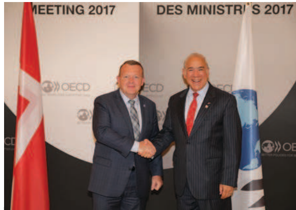
Den danske statsminister, Lars Løkke Rasmussen, og OECD's generalsekretær, Ángel Gurría, på ministerrådsmødet den 6. juni 2017 i Paris, Frankrig.

OECD har på det seneste offentliggjort flere rapporter om Danmarks politikker. Medlemslandene har gennemgået og godkendt anbefalingerne på lige fod.