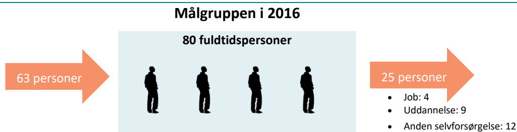
Figur 1: Status i dag: Målgruppens volumen, afgang og tilgang