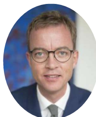
Miljø- og fødevareminister Esben Lunde Larsen