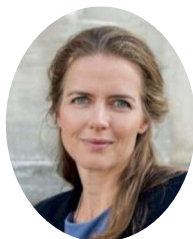
Sundhedsminister Ellen Trane Nørby

For at sikre fremdrift på området, vil vi som opfølgning på strategien gøre status efter 2 år med henblik på at kortlægge den samlede indsats.