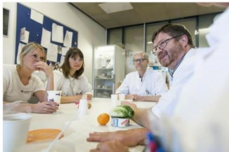
Don Fælles Akutmodtagelse, FAM, i Esbjerg har fået topkarakteren 4 i Sundhedsstyrelsens Inspektionsrapport. Det er første gang nogensinde, at en uddannelsesafdeling får topkarakter på samtlige funktioner.