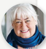
Thyra Frank Ældreminister

Jeg har selv besøgt Bonderupgård og oplevet, hvordan de skaber et rigtigt hjem med plads til forskellighed blandt mennesker, der er fælles om, at de gerne vil have dyr og ud i naturen. Og jeg må elske deres spontanitet. For det er forkert, at mennesker med demens kun skal have faste rammer og aldrig opleve noget nyt. Hvis der er nogen ved siden af dem, som de kender og føler sig trygge ved, så vil mange af beboerne med en demenssygdom gerne ud og opleve verden omkring dem.