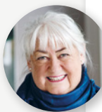
Thyra Frank Ældreminister

Jeg er rigtig glad for, at vi sammen med Transport-, Bygning- og Boligministeriet og Erhvervsministeriet er enige om at igangsætte en fælles indsats for at skabe flere seniorbofællesskaber i Danmark. Vi ved, at det er en boligform, der tiltaler mange, og med udsigt til flere ældre i fremtiden, er det en boligform, jeg rigtig gerne vil hjælpe på vej.