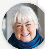
Thyra Frank Ældreminister

De pårørende er plejehjemspersonalets vigtigste samarbejdspartner. De har en livshistorie til fælles med det menneske, som det handler om. Særligt i forhold til demensramte kan de give os en viden, som vi ikke kan få andre steder fra. Hvad er personens livret, går han tidligt eller sent i seng, og hvilke daglige rutiner er vigtige for ham.”