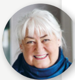
Thyra Frank Ældreminister

Når vi taler om ældre, der har mistet lysten til livet, er det vigtigt, at vi samtidig husker på, at det kan ændre sig. Jeg har set ældre, der er kommet på plejehjem og har mistet gnisten, lysten og troen på livet, men når de så bliver involveret i fællesskabet, sidder de pludselig og er glade og synger med tre måneder senere.