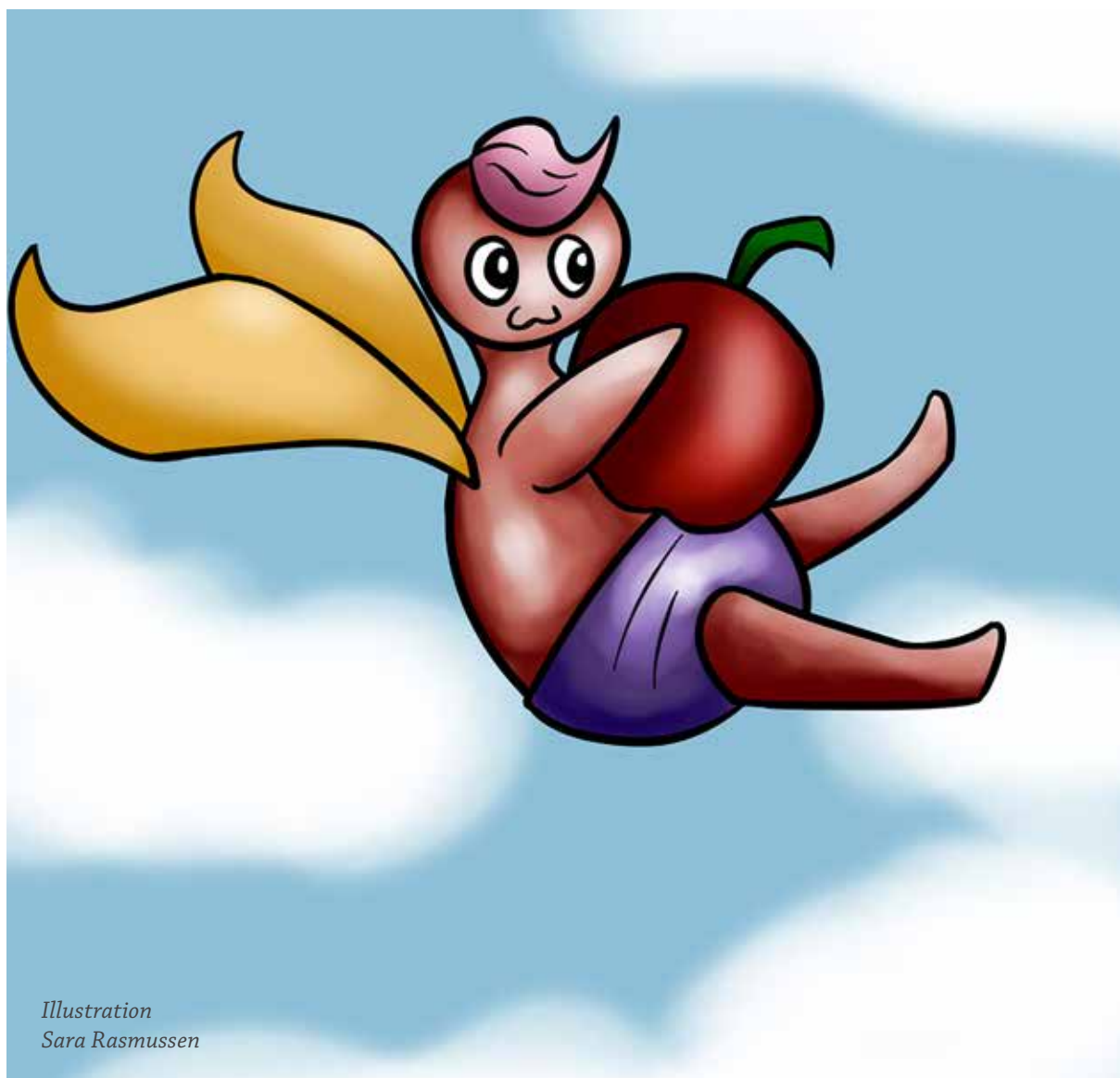
Illustration Sara Rasmussen

Mange folkeskoler og specialskoler forsøger at lave forskellige til-