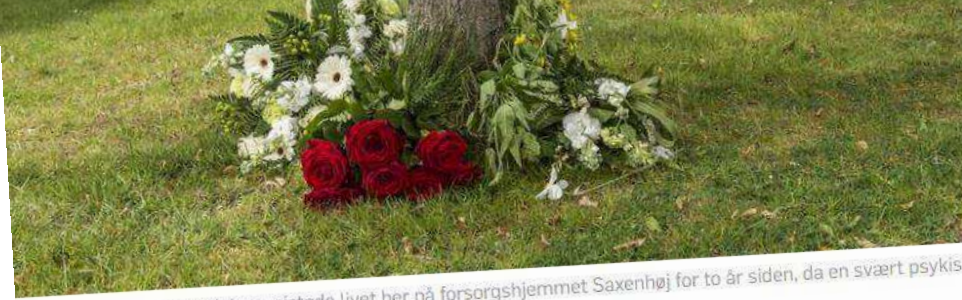
En læge og en socialrådgiver mistede livet her på forsorgshjemmet Saxenhøj for to år siden, da en svært psykisk med en brødkniv.