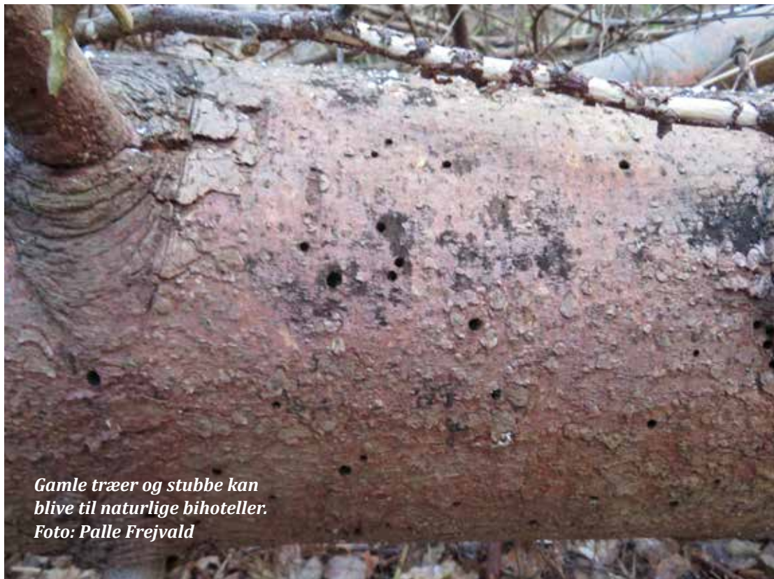
Gamle træer og stubbe kan blive til naturlige bihoteller.