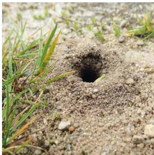
Figur 4. Redeindgang hos en jordboende bi, sandsynligvis en art af jordbi ( Andrena sp.).

Nogle enlige bier, særligt arter fra bugsamlerfamilien,