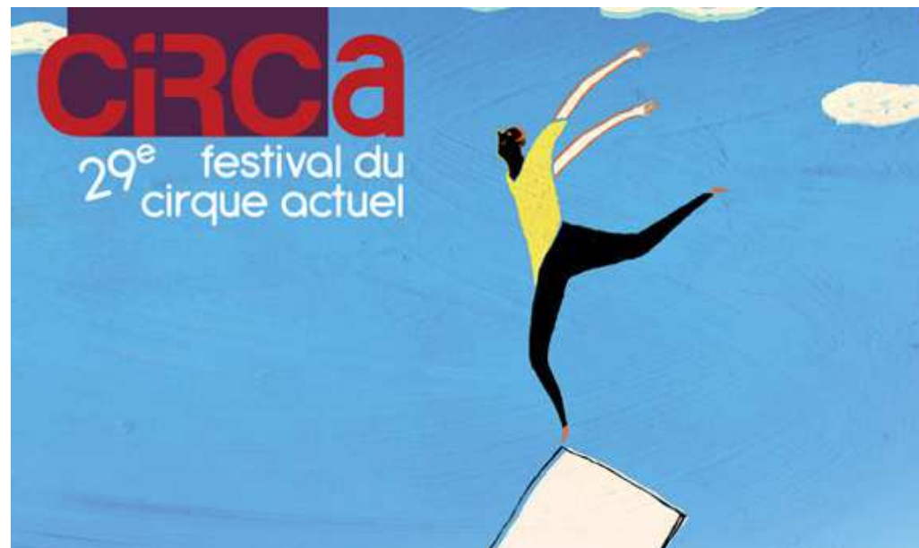
Circa festival 2016

AMoC indgår endvidere som partner i det EU støttede projekt INTENTS om uddannelse af cirkusundervisere. En af forsøgsuddannelsens erfarne cirkusundervisere har i den forbindelse været engageret som pædagogisk koordinator og tilrettelægger af et internationalt efteruddannelseskursus for cirkusundervisere i foråret 2017.