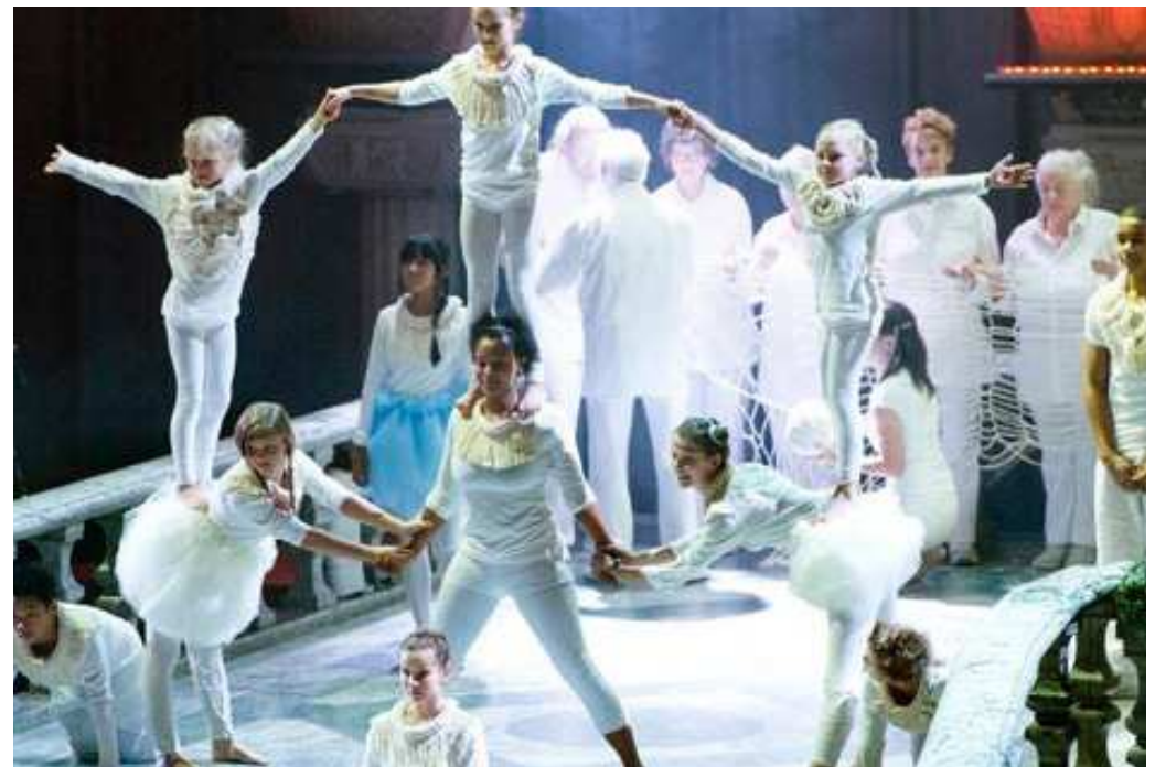
Cirkus Cirkör, Nobels festmiddag 2012