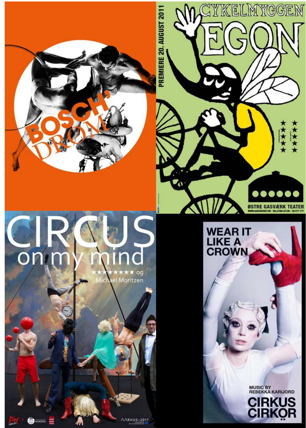
Diverse plakater fra Nycirkusforestillinger

Aarhus har med Cirkus Tværs en mange-årig tradition for at benytte cirkus som pædagogisk redskab, og kommunen satser nu på at udvide nycirkusfaciliteterne i den nye helhedsplan for Gellerup området.