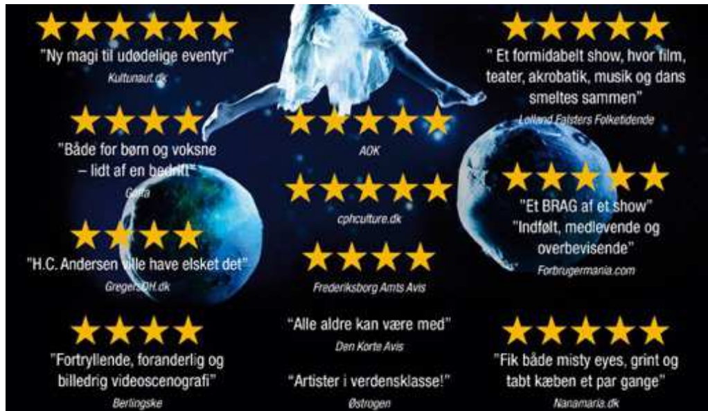
H.C. Andersen - Life is a Fairytale

“Where common belief is that artists are a drain on public funding as just more unemployed, HE circus arts graduates show on average a 90 % rate om employment 3 years after graduation. This employment rate is among the highest for any employment activity or for any subject that is awarded a degree at universit level. Circus artists form companies and those companies is turn employ other circus artists, so rather than being a drain on public resources, circus performers in the comtemporary sector actual stimulate growth through development and employment. They also stimulate growth by creating new initiatives for youth activities, by creating specialist business in rigging and in circus support. There is even evidence that the development of the circus sector, through the growth of graduate performances, has created new avenues for growth among lighting and sound technicians from theatre backgrounds as well as new opportunities for costume creators and composers.” (Tim Roberts 2012, tidl. president for FEDEC)