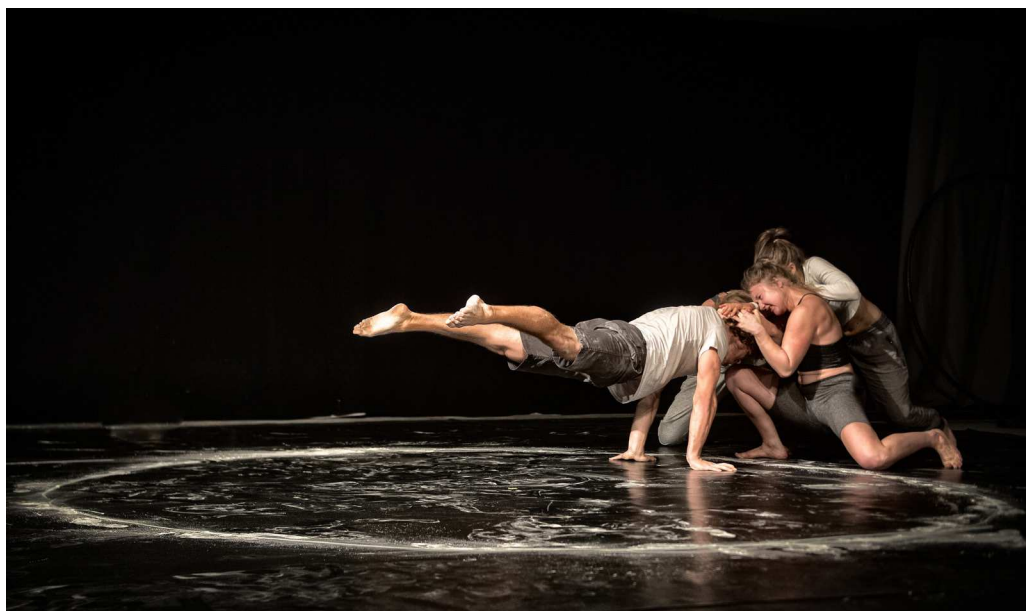
Circles - Circa, Auch 2015