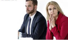
Morten Østergaard og Helle Thorning-Schmidt på et møde i Folketinget.

Fødselskassen blev et kædetag i 2014, for det var det første af deres mange sammenstød i regeringen.