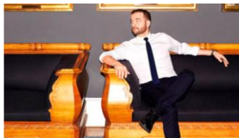
Morten Østergaard: "Jeg går glip af mange ting i mine børns liv" Afline Solbe Røggård | 11. juni 2019