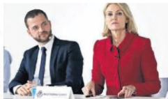
Morten Østergaard og Helle Thorning-Schmidt på et møde i Folketinget.

"SR-regeringen kæmpede fra pæl til pæl, siger De Radikales leder, Morten Østergaard, til magasinet Euroman."