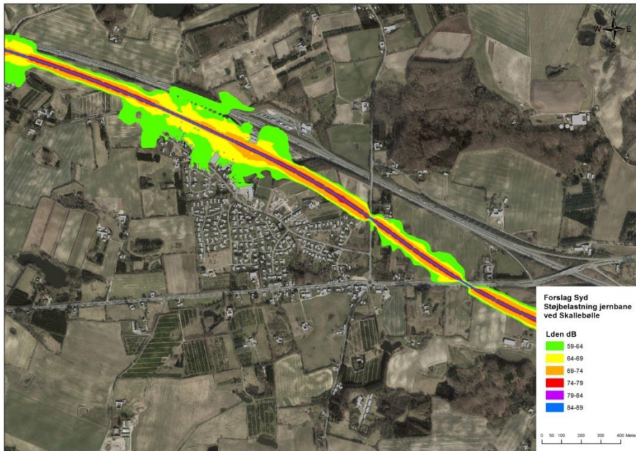
Støjudbredelse fra Jernbanen (Forslag Syd) ved Skallebølle