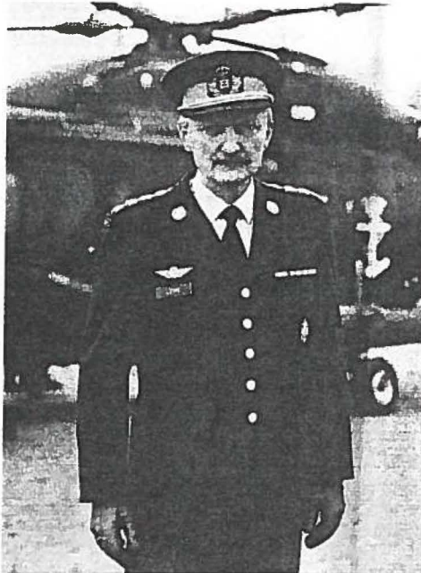
Forsvarschef Lyng luftede tanken i 1992 på Cypern