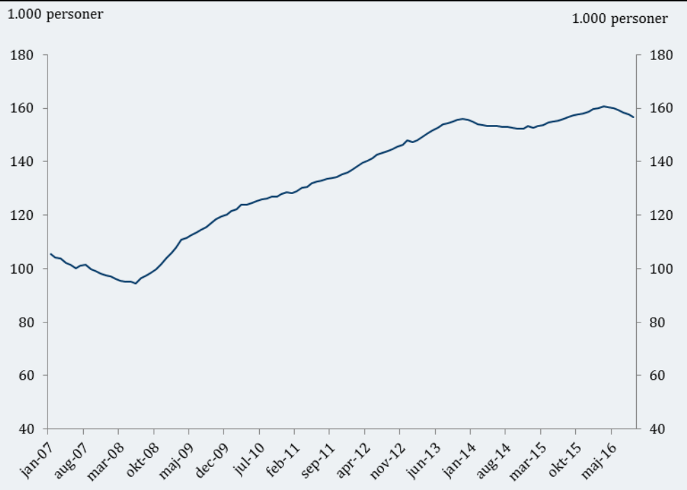
Figur 1. Antal personer på kontanthjælp, uddannelseshjælp og integrationsydelse, sæsonkorregeret, januar 2007 - september 2016

Anm.: Antal personer på kontanthjælp, uddannelseshjælp og integrationsydelse.