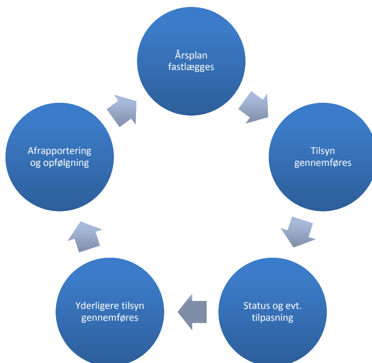
Figur 2. Årshjul

Tilsyn gennemføres enten som besøgstilsyn , hvor styrelsens medarbejdere fører tilsyn ved fremmøde på den enkelte centeradresse, eller som skriftlige tilsyn , hvor styrelsen på baggrund af operatørernes skriftlige dokumentation vurderer driften af operatørens center/centre.