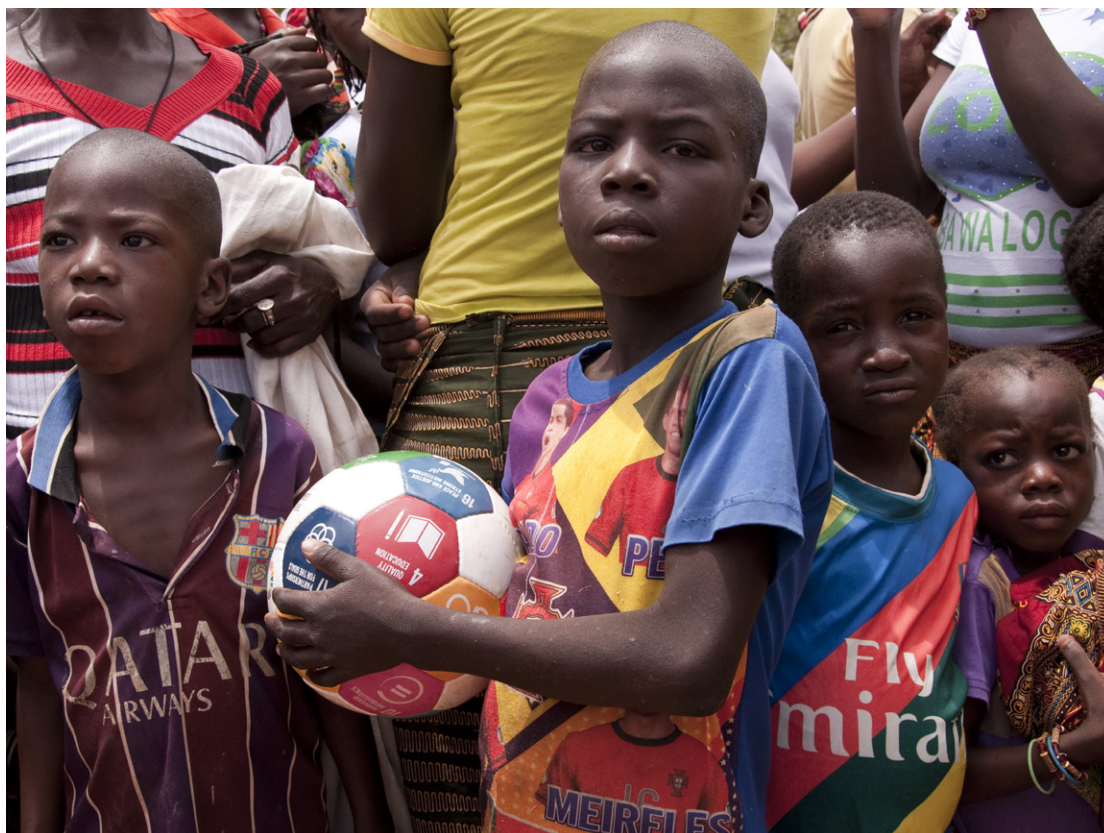
Dreng med dansk designet verdensmåls-fodbold i Kamsé Village i Kaya regionen, Burkina Faso.