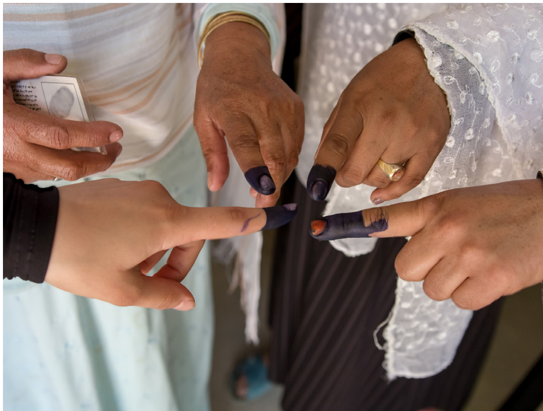
Afghanske kvinder, der har stemt til anden runde af præsidentvalget i Afghanistan i 2014.

Danmark vil være en markant global forsvarer for menneskerettigheder, demokrati og ligestilling. Vi vil fremme disse værdier i en lang række sammenhænge lige fra vores kontakt med private virksomheder til en aktiv deltagelse i FN-forhandlinger herom. Menneskerettigheder, demokrati, god regeringsførelse, retsstatsprincipper og ligestilling er et selvstændigt prioriteret område i det danske udviklingsamarbejde. Det er forudsætningen for at opnå verdensmålene og en integreret del af dem, særligt mål 5 (ligestilling) og mål 16 (fred, retfærdighed og institutioner), men også mål 1 (fattigdom), hvor jord- og ejendomsret fremgår. Danmark vil støtte demokratiers rettighed til at være demokratier, herunder som ligeværdige partnere i multilaterale organisationer – et vigtigt initiativ her er Naboskabsprogrammet, der er fokuseret på de skrøbelige demokratier i Ukraine og Georgien.