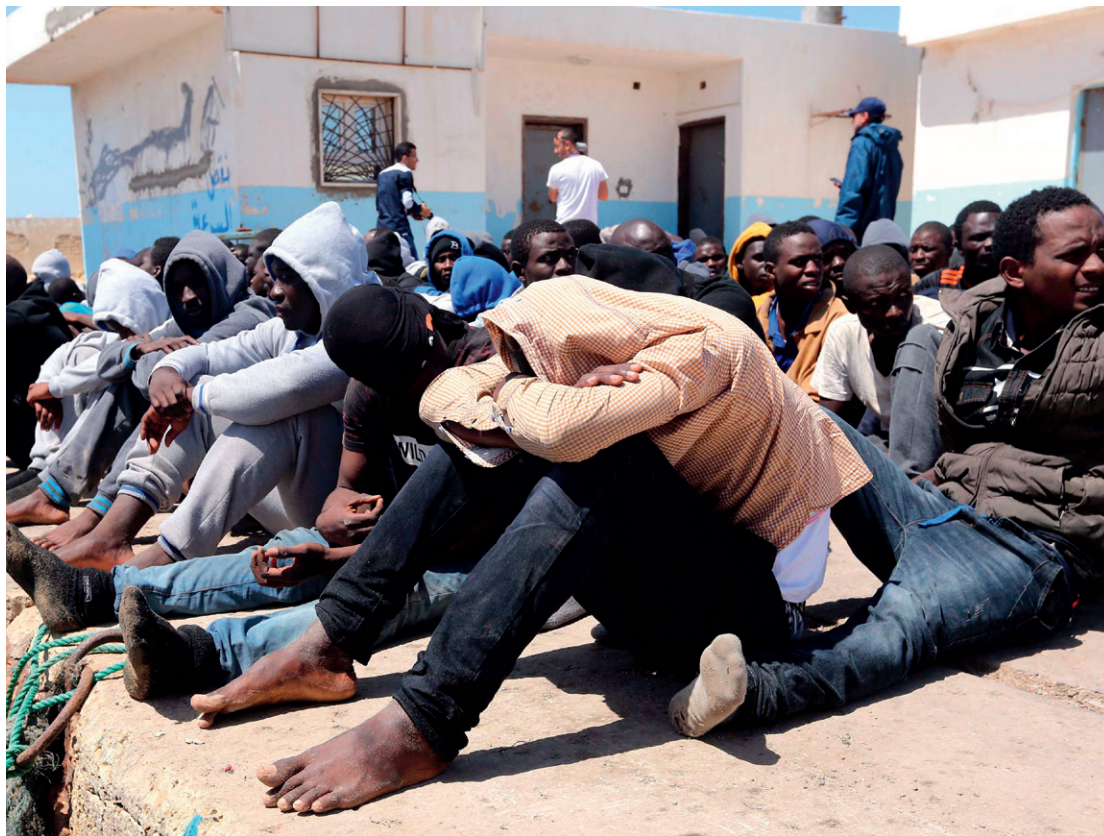
Irregulære migranter på havnen i Tripoli, Libyen, efter 117 migranter af afrikansk oprindelse blev reddet af to kystbåde ud for Libyens kyst.

Indsatsen for at stabilisere skrøbelige lande og situationer, skabe en gunstig, bæredygtig økonomisk og politisk udvikling hænger tæt sammen med håndteringen af fremtidige migrationsstrømme. Særligt mål 1 (fattigdom), mål 8 (vækst og beskæftigelse) og mål 16 (fred, retfærdighed og institutioner) er centrale for håndtering af migration sammen med stateres ansvar for at tage deres borgere tilbage, som indgår i 2030-dagsordenen.