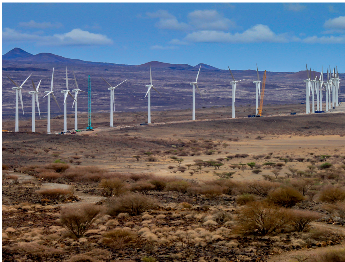
Afrikas største vindmøllepark Lake Turkana i Kenya med stort dansk fodaftryk. Vestas leverer 365 møller, mens Klimainvesteringsfonden og EKF bidrager til finansieringen.

Bæredygtig global vækst er i alles interesse og en forudsætning for at udrydde fattigdom. Det er en betingelse for at skabe jobs – særligt til unge. Det enkelte menneske skal have mulighed for og frihed til selv at indfri sit potentiale og tage hånd om egen og familiens skæbne. Bæredygtig økonomisk vækst skabes bedst gennem privat initiativ i en velreguleret markedsøkonomi, og som samtidig styrker global frihandel.