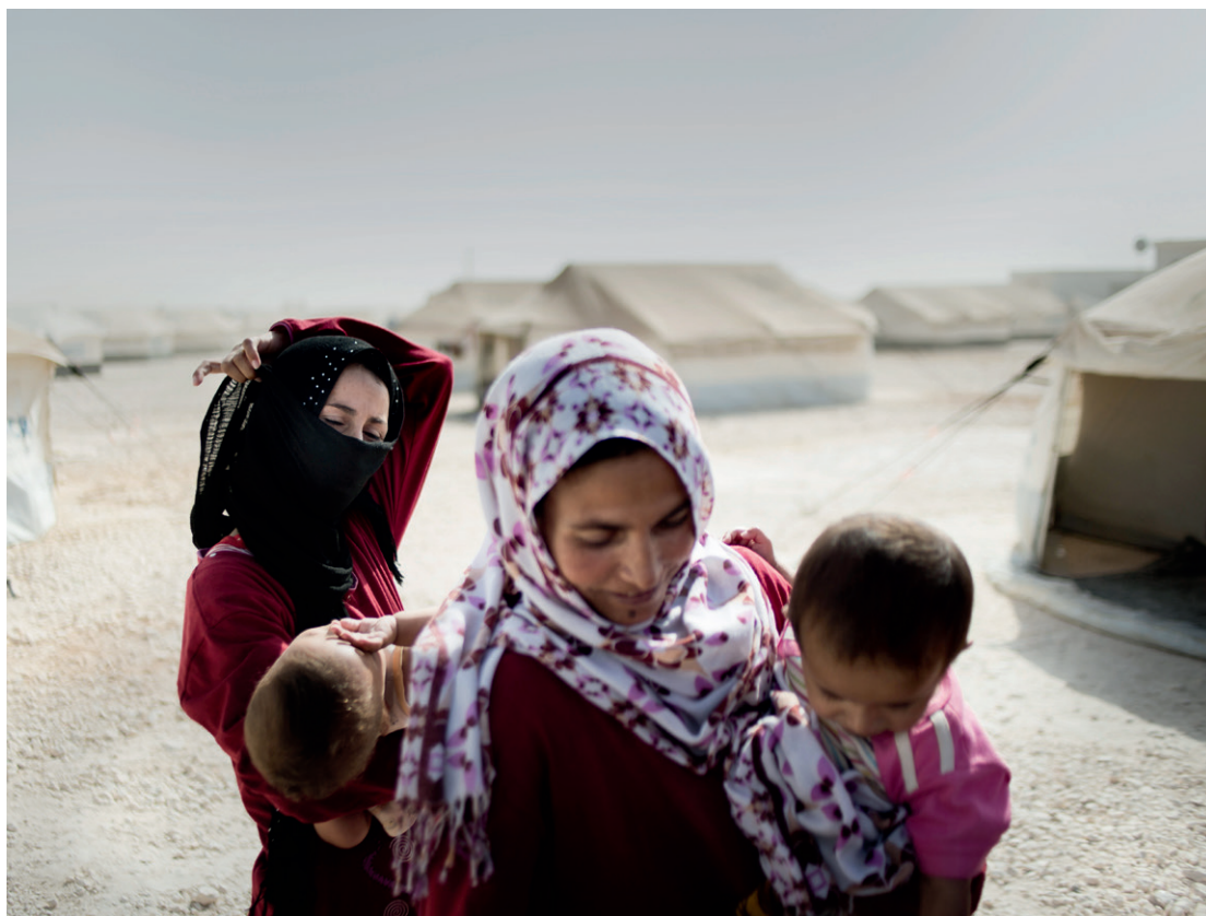
Familie netop ankommet i Zaatari flygtningelejr i Jordan, hvor omkring 80.000 syrere lever.

Fred og sikkerhed samt udfordringerne for lande ramt af konflikt og skrøbelighed står centralt i verdensmålene. Det gælder først og fremmest verdensmål 16 (fred, retfærdighed og institutioner), som vil stå centralt i det danske engagement. Derudover prioriterer vi i og omkring skrøbelige lande og situationer mål 1 (fattigdom), mål 2 (sult) og mål 8 (vækst og beskæftigelse). Vi fremmer også andre mål, bl.a. på det sociale område mål 4 (uddannelse) og mål 5 (ligestilling) gennem vores multilaterale indsatser og civilsamfundssamarbejdet.