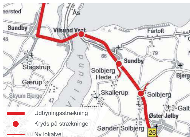
DELETAPE 12 Løsningsforslag mellem Øster Jølby og Vilsund