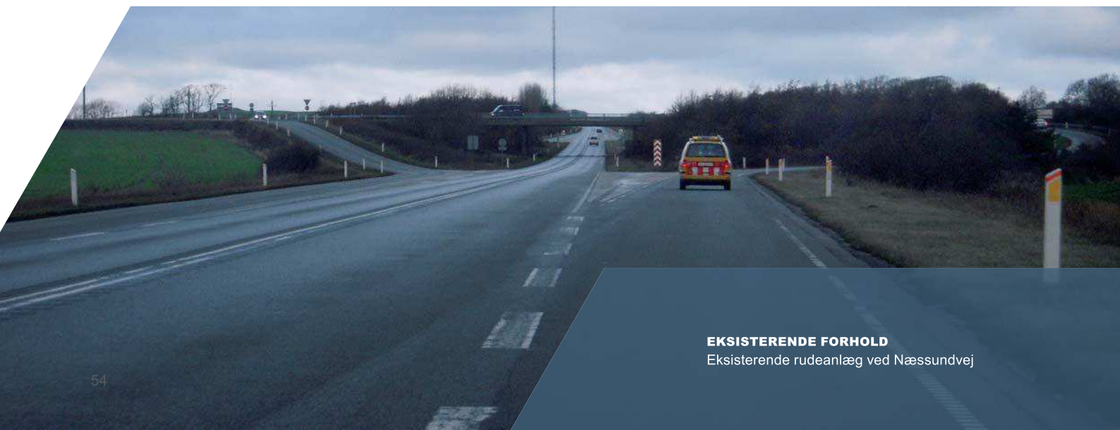
EKSISTERENDE FORHOLD Eksisterende rudeanlæg ved Næssundvej

Vejen forløber de første 2 km nord for Sallingsundbroen gennem et område med særlige drikkevandsinteresser.