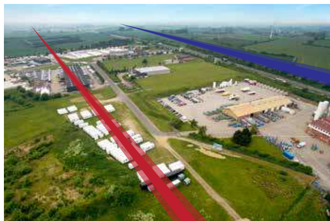
Den sydlige linje skærer tværs gennem eksisterende og nyt erhvervsområde.

Den dominerende gennemskæring vil begrænse eksisterende virksomheder i deres udvidelsesmuligheder – særligt virksomheder, der bliver lukket inde på arealet mellem motorvej og jernbane.