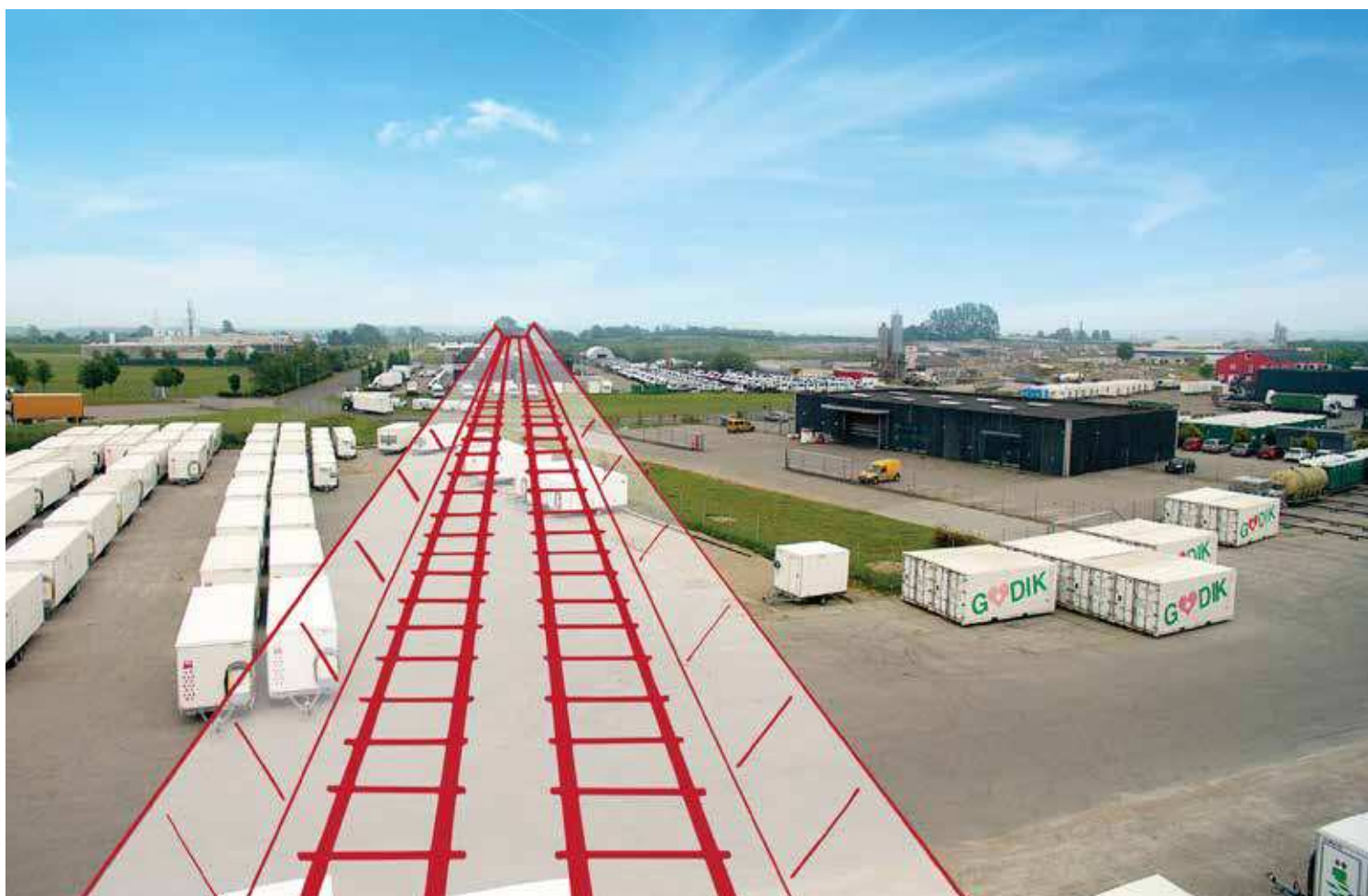
Den sydlige løsning vil løbe som en kanal gennem erhvervsområdet. På det bredeste sted bliver anlægget 70 meter.