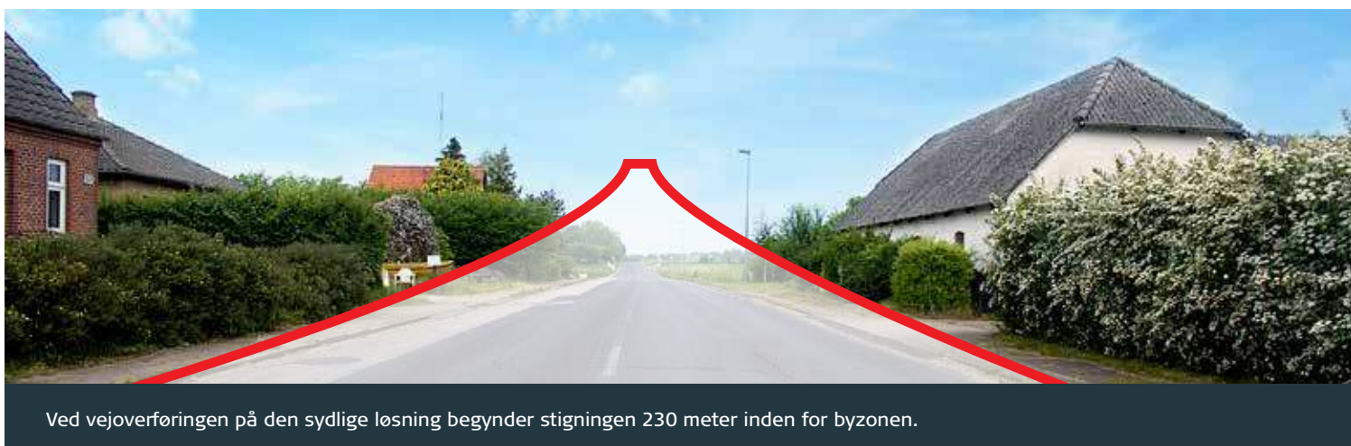
Ved vejoverføringen på den sydlige løsning begynder stigningen 230 meter inden for byzonen.