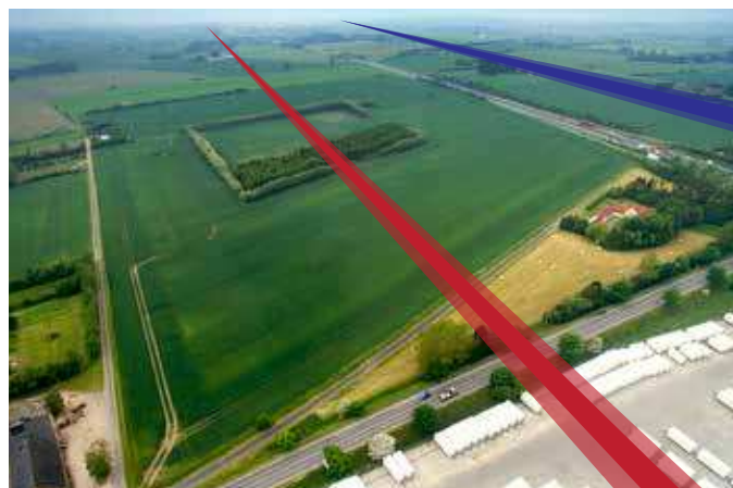
Den sydlige løsning løber tværs gennem kommuneplanlagt erhvervsområde.

Vælges den sydlige linjeføring står kommunen uden yderligere aktuelle salgsemner til erhvervsudvikling omkring Ejby.