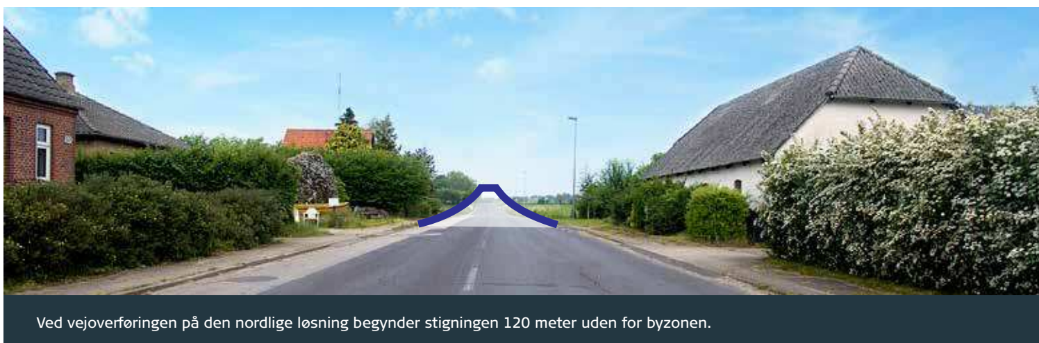
Ved vejoverføringen på den nordlige løsning begynder stigningen 120 meter uden for byzonen.