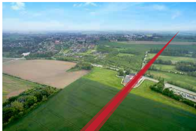
Den sydlige løsning vil omkring Assensvej have en totalbredde på 33 meter.

Den sydlige forbindelse vil omkring Assensvej have en totalbredde på 33 meter.