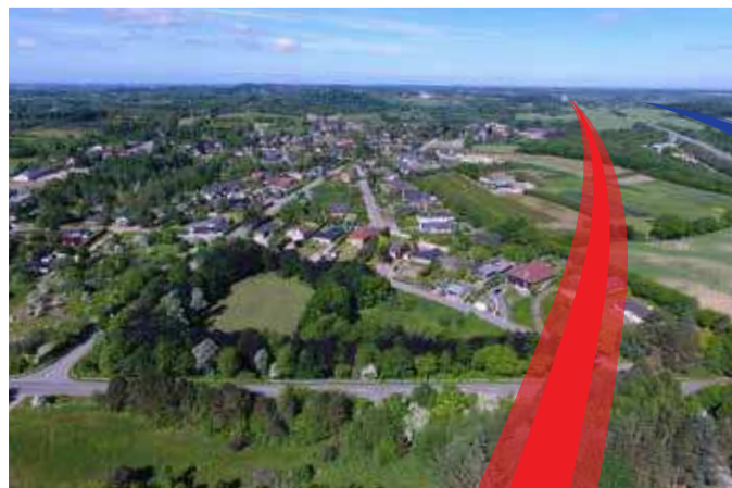
Den sydlige linjeføring berører en række ejendomme.

En række ejendomme påvirkes af den sydlige linjeføring, og borgerne er naturligvis stærkt påvirket af situationen.