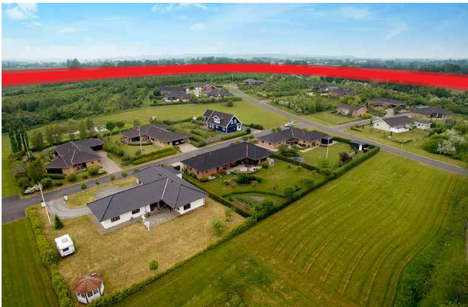
Den sydlige linjeføring ligger over vejterræn, mens den nordlige er sænket. Dermed vil den nordlige give den mindste visuelle påvirkning.