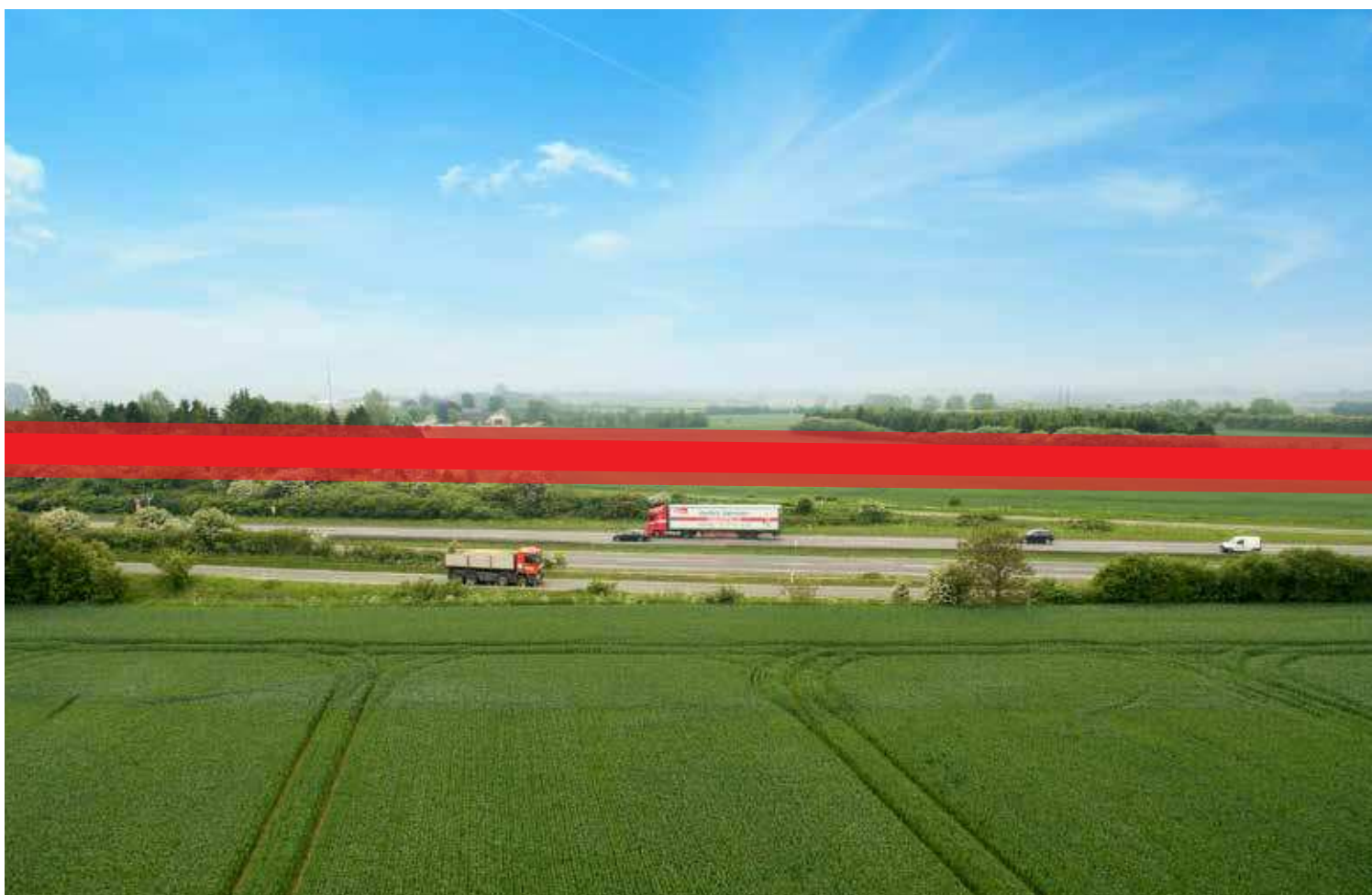
Det nye erhvervsområde er bl.a. attraktivt, fordi virksomhederne får optimal eksponering mod motorvejen. Den mulighed forsvinder med den sydlige linjeføring. Erhvervsområdet er her set fra den modsatte side af motorvejen.