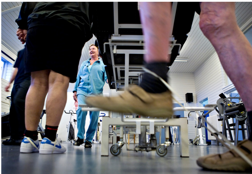
Genoptræning i en kommune.