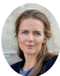
Ellen Trane Nørby Sundhedsminister