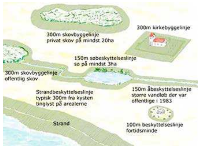
De forskellige beskyttelseslinjer i det danske landskab. Efter www.naestved.dk

Danske Juletræer anbefaler, at juletræer sidestilles med landbrug i relation til afstandskrav, men at der af hensyn til udsynet