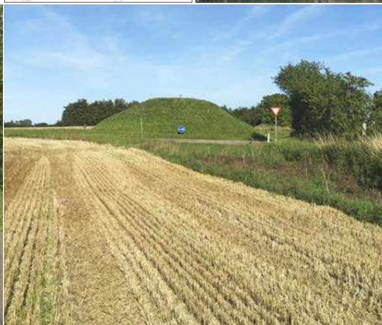
Kommunal kreativitet i anlæggelsen af en rundkørsel rundt om en gravhøj i Svendborg kommune. Bemærk hvordan beskyttelseslinjen påvirker store dele af de omkringliggende ejendomme.