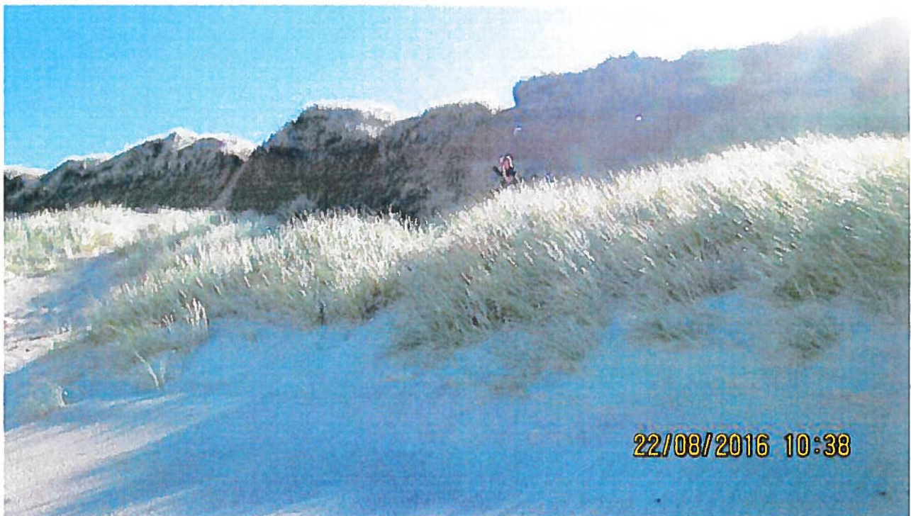
Klitten er rykket 30 meter frem siden ejeren og campisterne genetablerede anlægget ved Løkken strandcamping i 2001.