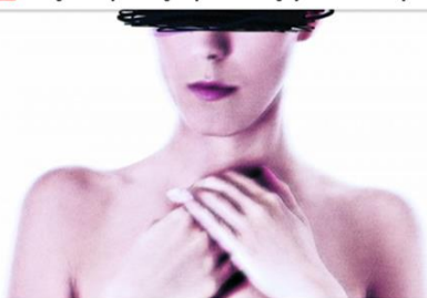
ARKIVFOTO - billedet er manipuleret

En hjemmeside fyldt med hævnporno ligger tilgængelig for enhver. Politiet jagter bagmændene.