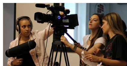
Public access til borgere