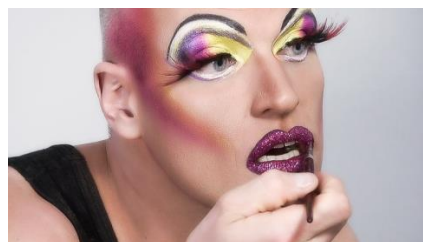
TV om minoriteter