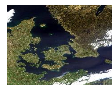
Satellit billede over de indre danske farvande