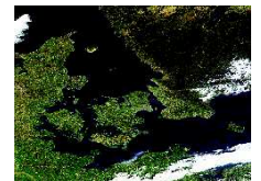
Satellit billede af de indre danske farvande