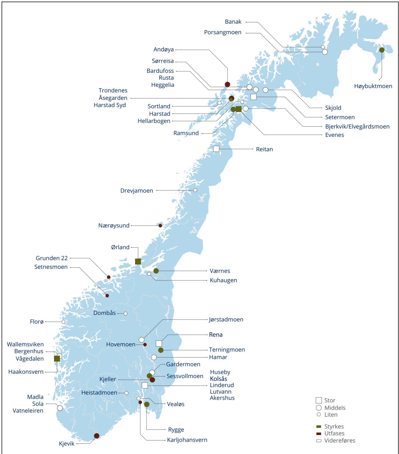
Figur 6.1 Oversikt over endringer i Forsvarets basestruktur