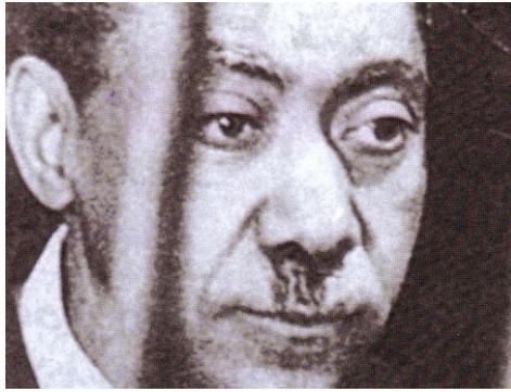
Sayyid Qutb, broderskabets chef-ideolog. Qutb var tilhænger af Adolf Hitler (se også Qutbs overskæg), som han mente var sendt fra Allah således, at jøderne kunne få ”den slemmeste straf”.

med det formål at fjerne og ødelægge den vestlige civilisation indefra og sabotere dets ynkelige hus med dets egne midler og med midler fra de rettroende, således at Guds religion gøres sejrrig over alle andre religioner.” 6