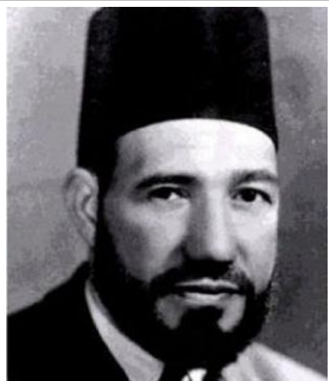
Hassan al-Banna (1906-1949), grundlægger af Det Muslimske Broderskab. Al-Banna om jihad: ” Jihad er en pligt fra Allah, som han pålægger samtlige muslimer, og som man ikke kan unddrage sig. Allah tillægger jihad stor vigtighed, og belønner martyrer og krigere som kæmper for ham, stort. ... Jihad [betyder] at bekæmpe de vantro, og involverer alle typer af indsats nødvendig for at nedbryde islams fjenders magt. Dette indbefatter at slå dem, plyndre deres rigdom, ødelægge deres religiøse steder og smadre deres hellige idoler.”

Daværende PM David Cameron kommenterede rapporten: "Hovedpointerne i rapporten støtter konklusionen om, at medlemskab af, tilknytning til, eller indflydelse af Det Muslimske Broderskab bør anses som et muligt tegn på ekstremisme ... dele af