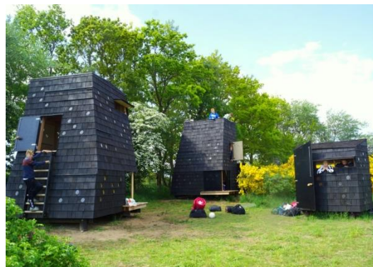
De arkitekttegnede shelters ved Fyns kyster.

Der findes mange gode eksempler på de lokale aktionsgruppers evne til at samle aktører på tværs af kommunegrænser. På Fyn har de to lokale aktionsgrupper, LAG SØM og LAG MANK (SØM: Syd-, Øst- og Midtfyn, MANK: Middelfart, Assens, Nordfyn og Kerteminde), i 2015 taget initiativ til, samt støttet, etableringen af Blå Støttepunkter Fyn rundt – topmoderne naturpladser med shelterfaciliteter langs kysten. Bag projektet står en arbejdsgruppe bestående af de fem involverede kommuner, de fem lokale turistorganisationer samt LAG SØM og LAG MANK.