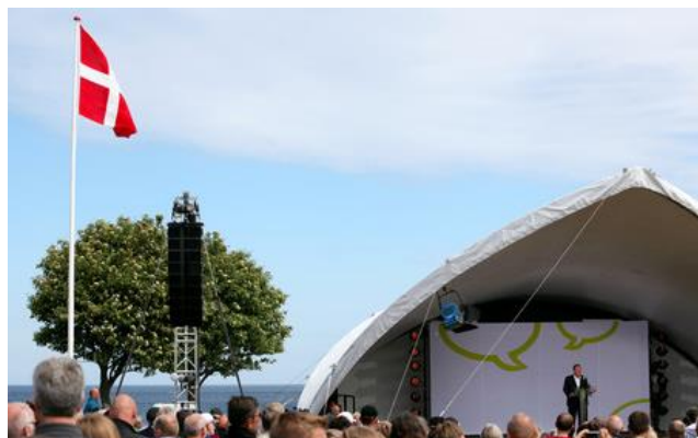
Folkemødet i Allinge.

I midten af juni har Allinge på Bornholm de seneste fire år lagt gader, stræder og pladser til Folkemødet. Inspirationen kom fra den svenske "Almedalsveckan", og på bare fire år er Folkemødet blevet et tilløbsstykke uden lige, med en stigning på mere end 38.000 overnatninger og en bruttoværditilvækst på mere end 20 mio. kr. som følge. Startskuddet til Folkemødet var et udviklingsarbejde støttet af LAG Bornholm.