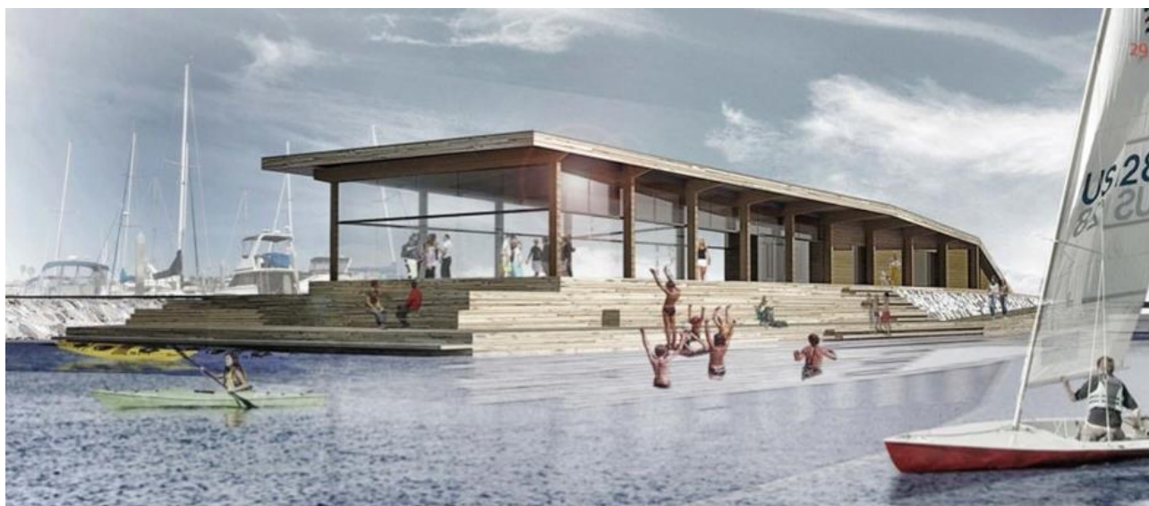
Maritimt Aktivitetshus Røsnæs, som er under opførelse. Tegning fra ansøgningsmateriale.

I landets største lokale aktionsgruppe, LAG Midt-Nordvestsjælland som dækker kommunerne Odsherred, Holbæk, Lejre, Sorø og Kalundborg, gik en tredjedel af tilskudsmidlerne i 2015 til direkte at støtte udvikling inden for turismeerhvervet, og mere end fire ud af fem af de støttede projekter bidrager til udviklingen af turismen i området. En anden tredjedel af støttemidlerne gik til at skabe bedre servicefaciliteter og rammevilkår i området, hvilket i høj grad også understøtter turismen. De forbedrede servicefaciliteter tæller blandt andet et Maritimt Aktivitetshus på Røsnæs Havn, der som et blåt anker for oplevelsesruten "Røsnæs Rundt" vil komme mange turister til glæde hvert år; samt en storskærmsbiograf på Holbæk Havn, hvor turister og lokale får mulighed for gratis at følge store sportsbegivenheder og gode film under den danske sommerhimmel, for bare at nævne et par eksempler. Mere end halvdelen af de udelte tilskudsmidler fra LAG Midt-Nordvestsjælland gik i 2015 således til direkte eller indirekte at understøtte udviklingen af turismen for området som helhed. Flere af landets andre lokale aktionsgrupper har i 2015 støttet turisme-relaterede projekter med helt op til 85 % af deres tilskudsrammer for 2015.