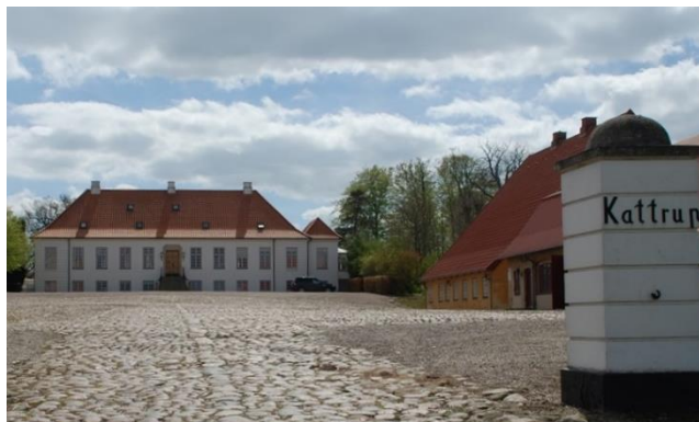
Katstrup Gods med Vævernes Hus til højre.

De lokale aktionsgrupper har de lokale kulturværdier og stedsbundne ressourcer som en hjørnesteen i deres fundament, og er derfor i høj grad bevidste om at indtænke de lokale, kulturelle potentialer i de projekter, der støttes. LAG'erne er således med til at øge udbuddet og kvaliteten af kultur- og fritidsaktiviteter, som efterspurgt af turisterne. De lokale aktionsgruppers store lokalkendskab og netværk understøtter samtidigt synergier omkring disse kulturelle fokuspunkter, så synlighed og effekt øges. Et eksempel er projektet 'Vævernes hus', som foreningen Vævere i