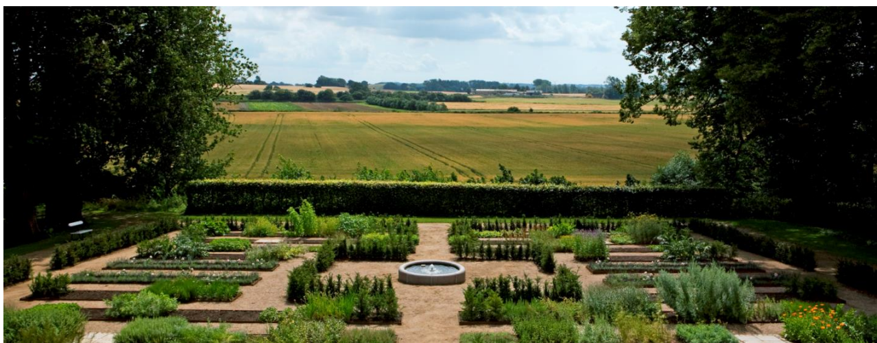
Urtehaven på Dragsholm Slot i Odsherred, med den inddæmmede Lammefjord i baggrunden.