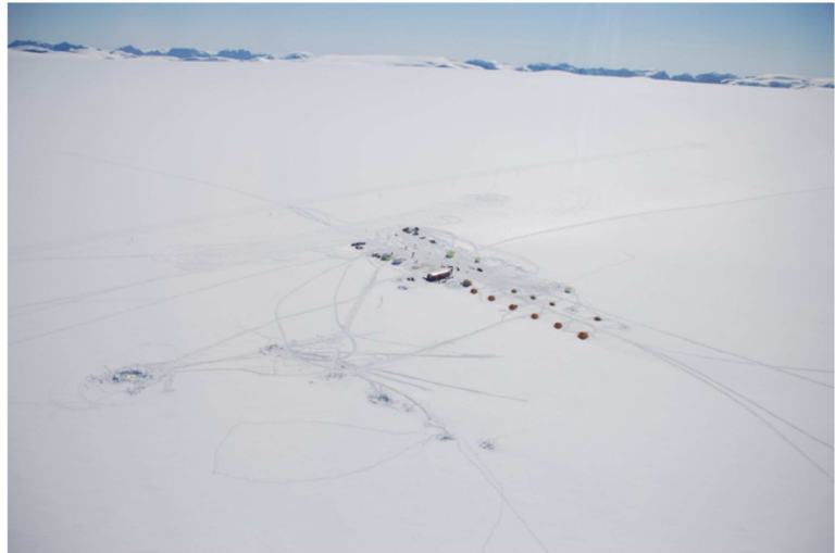
Andre fordele ved jobbet ...