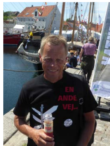
Lennart Damsbo-Andersen Formand for Folketingets Transport- og Bygningsudvalg.

“Det gælder både de arbejdspladser, der etableres i forbindelse med bygningen af broen, men også den stabilitet, der kan skabes på Lolland-Falster, når området får adgang til et stort fleksibelt arbejdsmarked.”