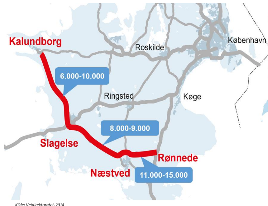
Figur 4: Årsdøgns trafikken på de tre delstrækninger

Den forudsatte trafikvækst er naturligvis en afgørende parameter i forbindelse med den samfundsøkonomiske analyse. Jo større vækst, desto flere trafikanter sparer køretid, og jo større er projektets benefits og dermed rentabilitet, så længe investeringerne er de samme.