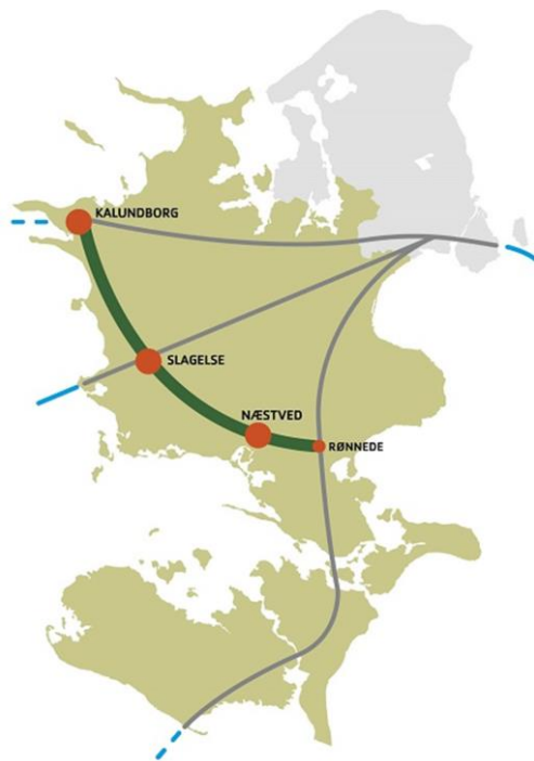
Figur 1: Den Sjællandske Tværforbindelse med strækningens centrale knudepunkter

Denne rapport præsenterer resultaterne af en sådan samfundsøkonomisk analyse af "Den Sjællandske Tværforbindelse" med en motorvejsforbindelse mellem Rønnede og Kalundborg. Forbindelsen består af tre dele, nemlig strækning 22 mellem Slagelse og Kalundborg og mellem Næstved og Slagelse samt strækning 58 mellem Rønnede og Næstved. Der er ikke regnet med nogen opgradering af de to ringveje omkring Næstved og Slagelse, der udgør en 2+1 motortrafikvej på cirka 7 km omkring Næstved og en nyetableret 2-sporet landevej omkring Slagelse på 9 km. Den samlede strækning fra Rønnede til Kalundborg er på ca. 86 km. inkl. de to nævnte ringforbindelser.