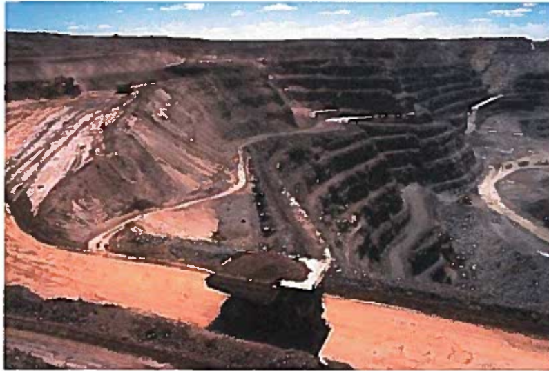
Where wind turbines really come from.