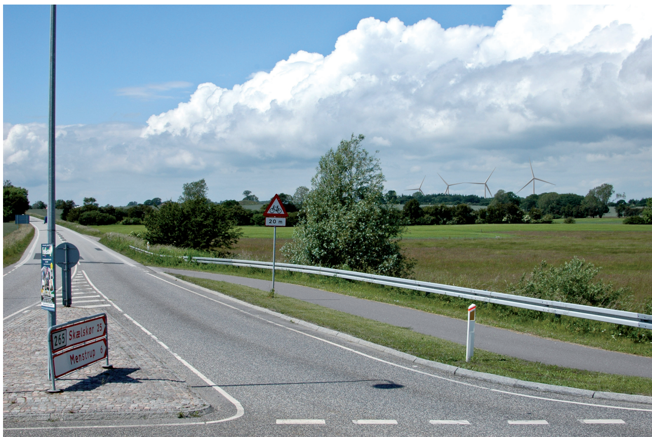
Visualisering med fire møller på op til 140 meter set fra Rute 265 ved Nybro ca. 2 km sydøst for mølleområdet ved Saltø Gods.