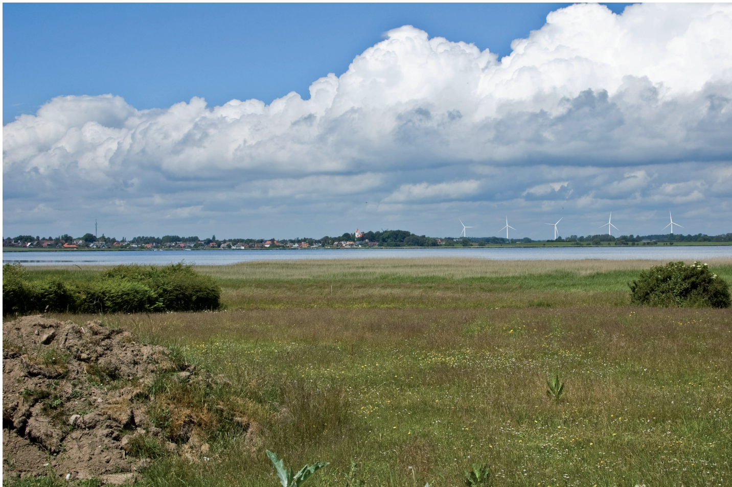
Visualisering med fem møller på op til 149,9 meter set fra Enø ca. 5 km sydøst for mølleområdet ved Saltø Gods.

møller à 250 kW med en totalhøjde på 45 meter øst for Menstrup. De øvrige eksisterende møller er alle placeret mere end 2,5 km fra de nye møller ved Saltø Gods.