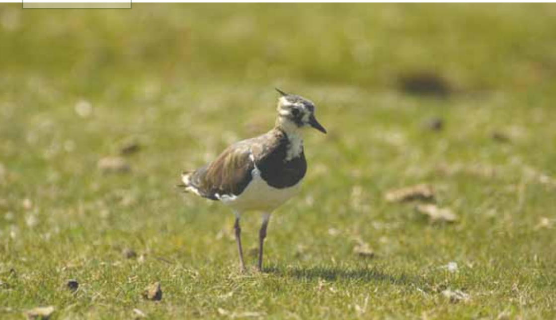
Vibe på strandeng

DANMARKS NATURFREDNINGS- FORENING ANBEFALER REGERING, FOLKETING OG KOMMUNER