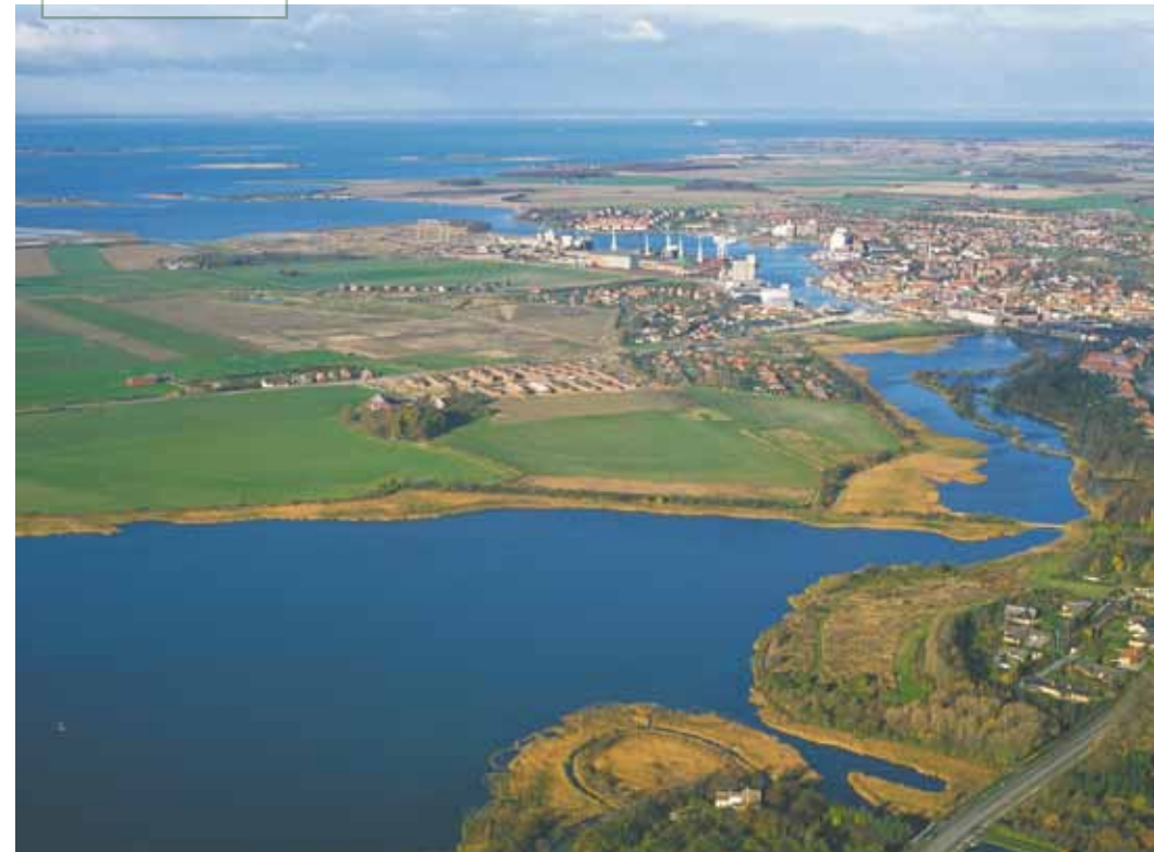
Lavvandet kyst ved Nakskov Fjord med dyrkede marker omgivet af diger.

Danmarks Naturfredningsforening mener således ikke, at der bør gives tilladelse til kystsikring af for eksempel naturområder, nye sommerhusområder, spredt bebyggelse og landbrugsjord, der ikke tidligere har været kystsikret. Heller ikke sommerhusområder på kyster, som er stærkt præget af kystnedbrydning – som f.eks. mange steder langs den jyske vestkyst – bør kunne kystsikres med faste anlæg. I den sammenhæng spiller den foreslåede statslige kortlægning af, hvornår ansøgninger om kystsikring kan forventes imødekommet eller afslået, en væsentlig rolle.