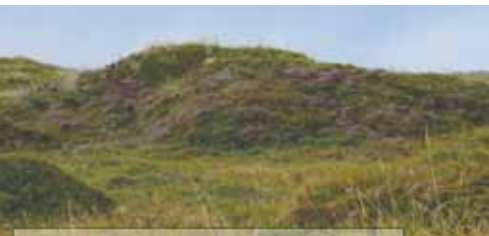
Kystkliitter med dværgbuskvegetation