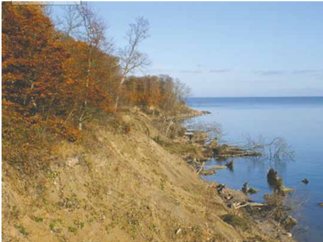
Nedbrydningskyst ved Fredericia.

udbyggede sommerhusområder, hvor de naturlige kystprocesser påvirkes minimalt af kystsikringen, og hvor der er væsentlige samfundsmæssige tab ved ikke at kystsikre, f.eks. ved lavvandede kystområder, hvor diger med højvandssluse kan sikre bebyggelser mod oversvømmelse.