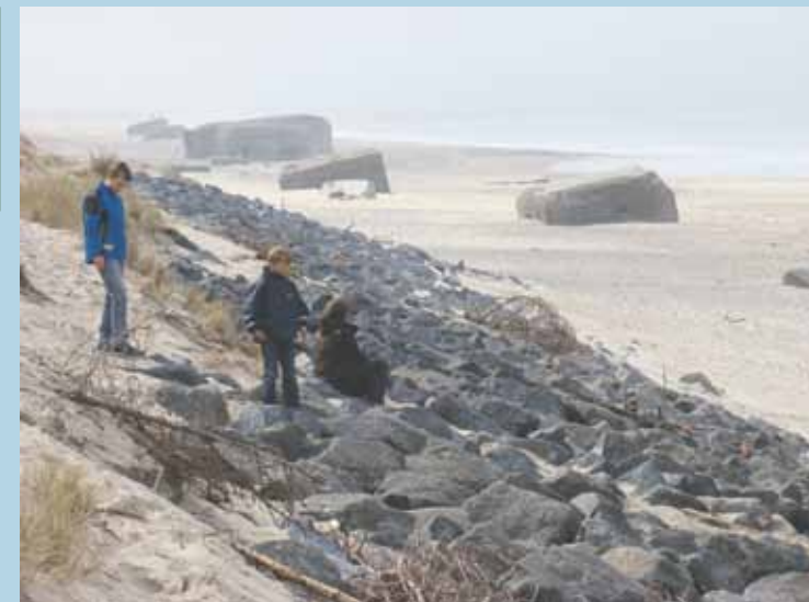
Skræntfodssikring med sprængsten og nedfaldne fyrregrene fra sandflugtsdæmpning af klit. Søndervig, Vesterhavet.

Skræntfodssikring skal hindre den naturlige bølgenedbrydning af kystskrænter. De består typisk af sten ud fra skræntefoden og et stykke op ad skrænten. Mange steder har private grundejere skræntsikret med f.eks. bygningsaffald og grenaffald. Skræntfodssikring kan hæmme den frie færdsel. Langs Vestkysten udføres skræntsikring for at hindre gennembrud af smalle tanger. Skræntfodssikring bør kun forekomme, hvor sandfodring og dækmoler ikke slår til, og da kun med naturnære materialer.