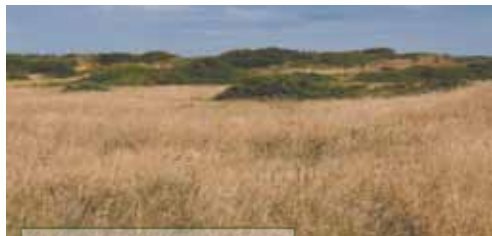
Kystkliitter med enebær

Læs mere på www.dn.dk/kyst , hvor der er link til Miljøministeriets bog om de enkelte naturtyper.