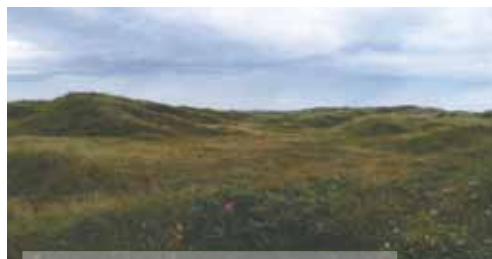
Kystkliitter med urteagtig vegetation