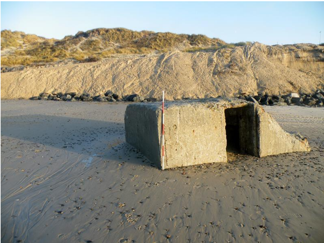
Stranden var sænket 1 meter d. 11 december 2013 efter stormen Bodil på grund af de mange betonklodser på stranden