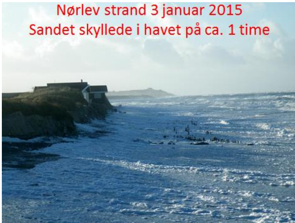
Sandfodringen skyllede i havet på en time d. 3 januar 2015