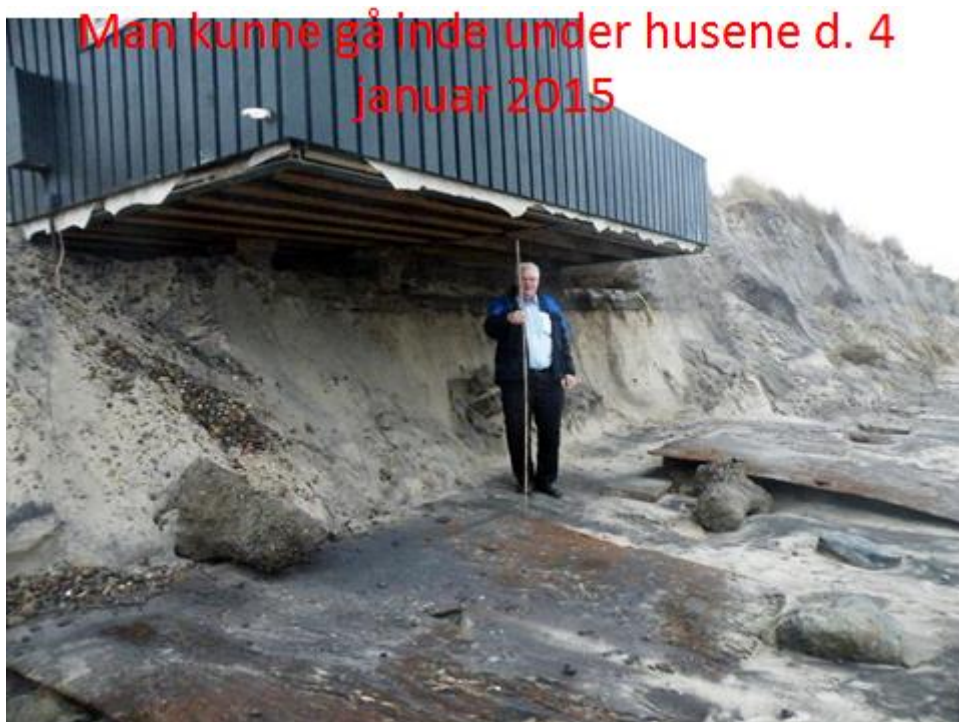
Her står jeg inde under huset d. 4 januar 2015 med en 2 meter lang tommestok