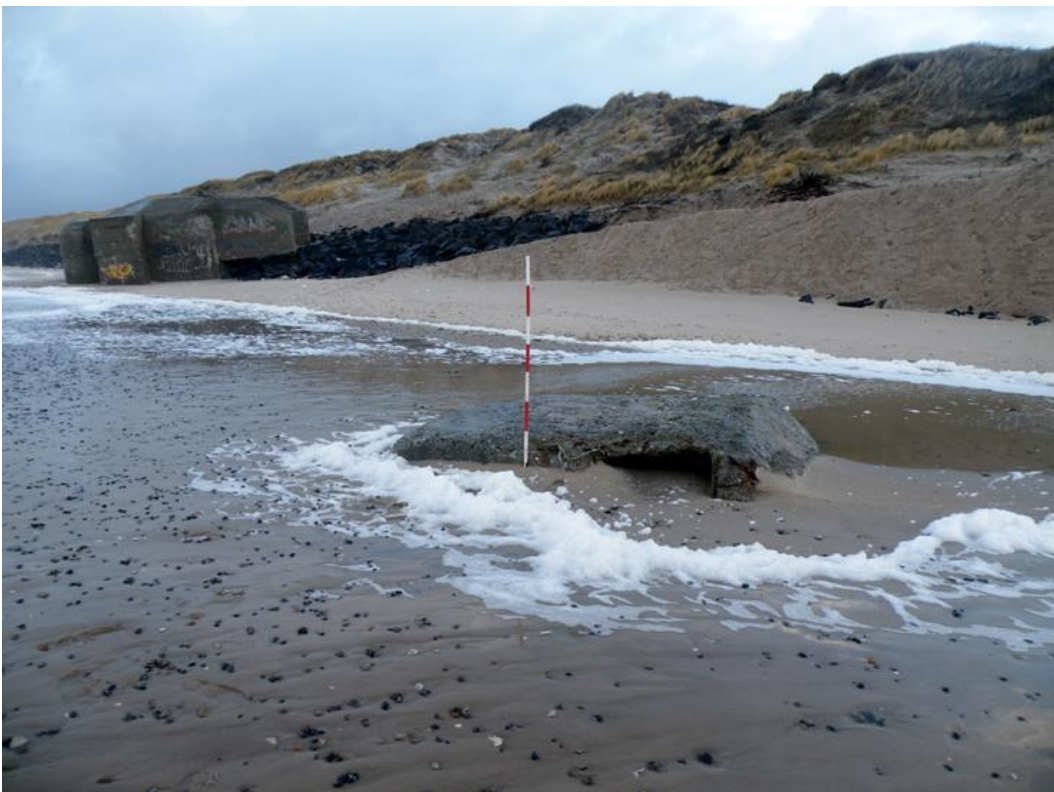
11 januar 2014. Det tog 1 måned at genopbygge stranden med SIC systemet