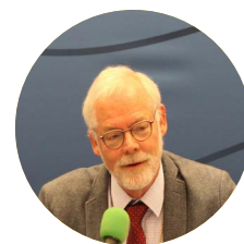
AF BISKOP STEEN SKOVSGAARD