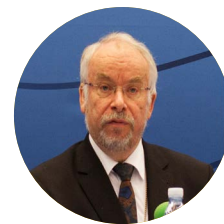
AF BISKOP PETER SKOV- JAKOBSEN