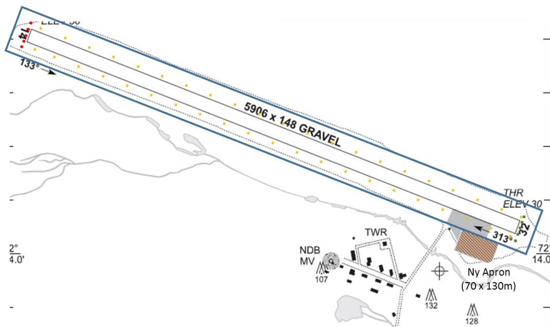
Figur 2: Mestersvig med installationer til civil trafik (rullevej, ny apron, hangar og sikkerhedszone)

Materiel til banevedligeholdelse (snerydning, brand og redningsudstyr, baneforbedringsudstyr (dozer), m.m.) ligesom flytbart udstyr som strøm- og nødstrømsgeneratore forventes fragtet til Mestersvig fra Constable Pynt, såfremt Forsvarets udstyr ikke er tilstrækkeligt, og hvor omkostninger til fragtning rimeliggør dette, udstyrets tilstand og restlevetid taget i betragtning.