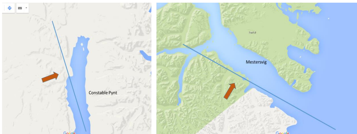
Figur 3: Flyveretning ved an- og udflyvning i Mestersvig hhv. Constable Pynt

For så vidt angår omkostninger ved manglende regularitet har Air Greenland i tidligere analyser anført, at op mod 50% af alle flyvninger på Constable Pynt måtte aflyses på grund af dårligt vejr, herunder specielt turbulens i forbindelse med an- og udflyvning til Constable Pynt. En overordnet sammenligning af an- og udflyvningsforhold er vist i nedenstående figur.