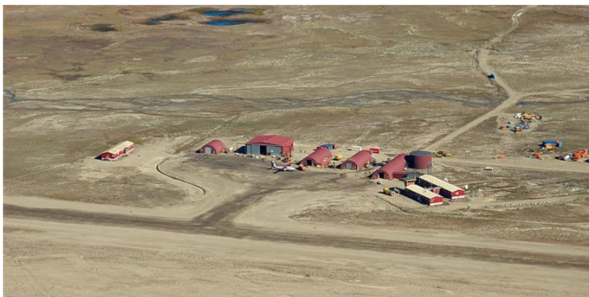
Figur 1: Lufthavnen i Nerlerit Inaat

Lufthavnen ligger 40 km fra Ittoqqortoormiit, som betjenes med helikoptere af Air Greenland. Denne tur tager cirka 15 minutter. I de gældende Air Greenland tidsplaner er der 6 daglige flyvninger mellem Constable Pynt og Ittoqqortoormiit. Herudover anvendes lufthavnen af chartrede fly (General Aviation) i forbindelse med ekspeditioner i området eller til Nordøstgrønlands Nationalpark. Endelig betjener lufthavnen en Search & Rescue helikopter, som primært er placeret ved heliporten i Ittoqqortoormiit.