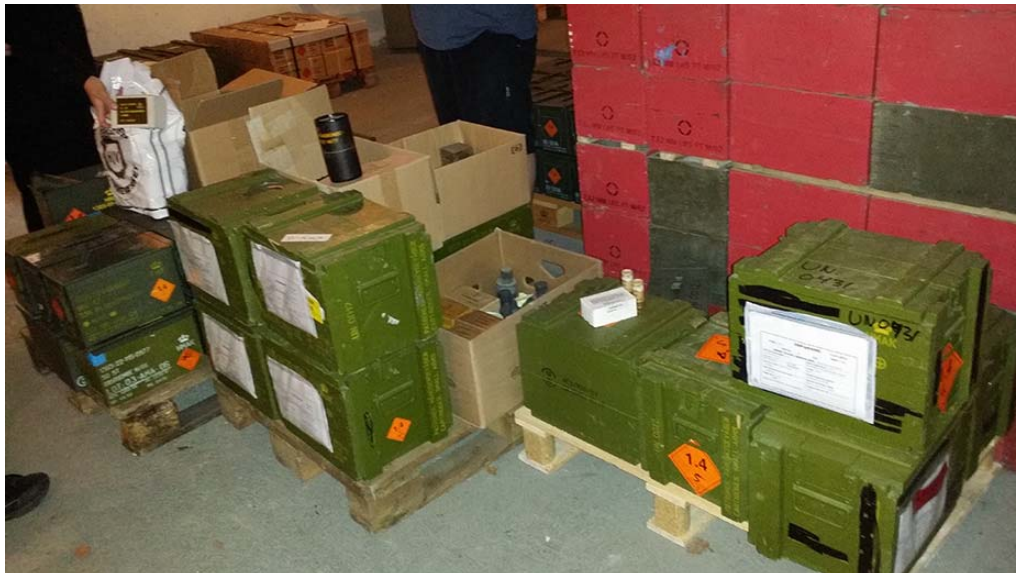
Ammunition, som skal destrueres og ikke er registreret i DeMars.

32. Rigsrevisionen har i forbindelse med besøg ved Forsvarets depoter konstateret beholdninger af ammunition mv., som afventede destruktion, og som ikke var registreret i DeMars. Det er Rigsrevisionens vurdering, at sådanne beholdninger af uregistreret ammunition medfører risiko for, at ammunition kan mistes, uden at Forsvaret er opmærksom på det.