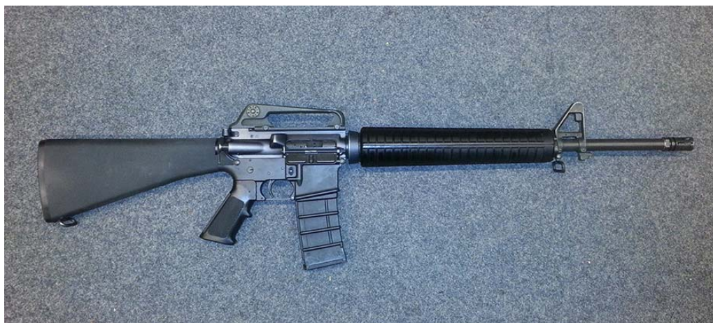
Gevær af typen GV M/95, som Forsvaret anvender. Et frarøvet våben af denne type blev brugt ved skudepisoden ved Krudtønden i februar 2015.

Forsvaret skal ifølge sikkerhedsbestemmelsen rapportere tab og fund af våben og ammunition via en fortrykt blanket i sikkerhedsbestemmelsen.