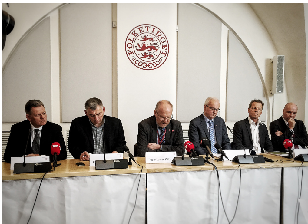
Alle statsrevisorer til stede på pressemøde - fra venstre: Lars Barfoed (K), Klaus Frandsen (RV), Peder Larsen (SF), Henrik Thorup (DF), Lennart Damsbo-Andersen (S) og Søren Gade (V)

anmodning, da man havde hæftet sig ved de seneste års mange og alvorlige problemsager i Skatteministeriets og SKATs forvaltning, samtidig med at styringen skulle håndtere faldende bevillinger og skærpede krav til effektiviseringer. Statsrevisorerne kritiserede skarpt, at Skatteministeriet ikke havde sikret rammer og grundlag for en tilfredsstillende opgaveløsning i SKAT.