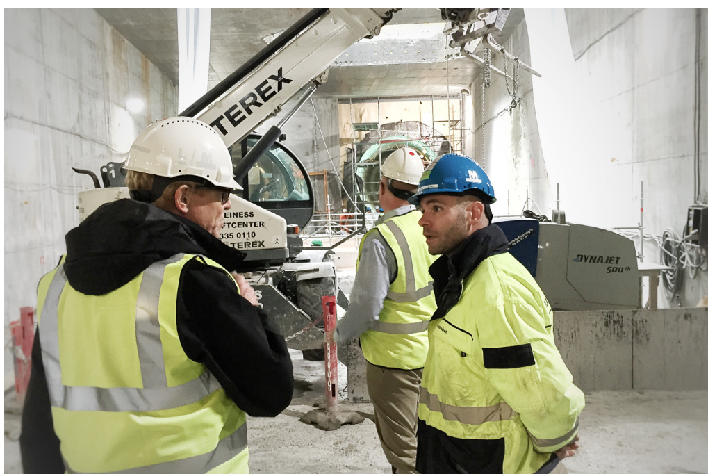
Under jorden: Starten på stationen på Sønder Boulevard

Statsrevisorerne konstaterede, at der var risiko for, at Cityringen ville blive forsinket og/eller fordyret. Statsrevisorerne har i november 2015 afsluttet beretningen, da opfølgningen viste, at Metroselskabet nu styrer efter kontrakttidsplanen, at åbning kan forventes i juli 2019, og at anlægssummen vil blive forøget med ca. 1 mia. kr. til 23,5 mia. kr. (2014-priser).