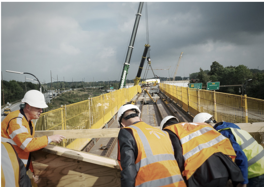
Jernbanebroen over Ring 4 ved Vallensbæk

systematisk overbudgettering. Derfor bør man sørge for at reducere de generelle reserver i takt med, at risici reduceres, hvilket forudsætter en stærk risikohåndtering og grundig vurdering af de økonomiske konsekvenser. Statsrevisorerne vil følge udviklingen i forbindelse med opfølgningen på Beretning 22/2014 om projektet "Den nye bane København-Ringsted" .