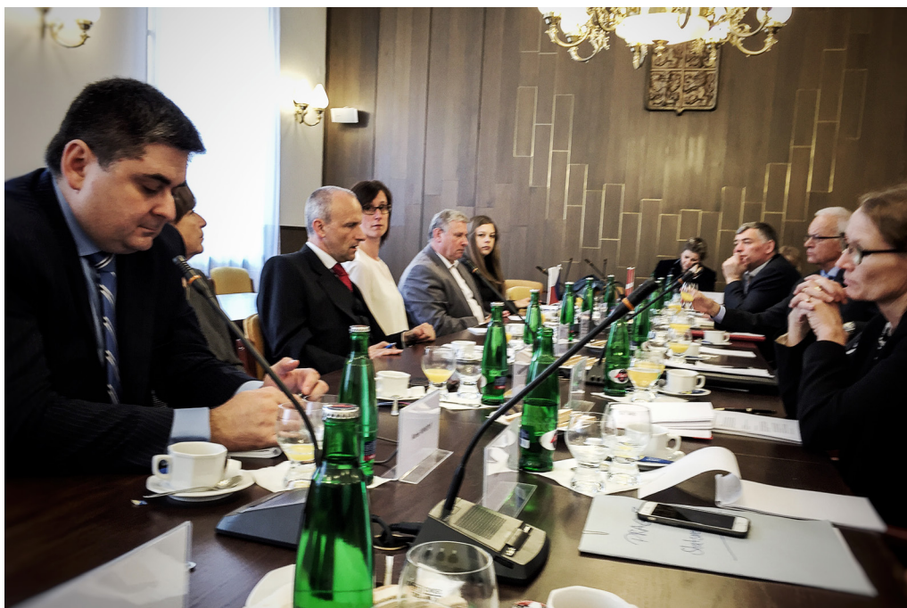
Til møde med revisionsudvalget i Tjekkiet