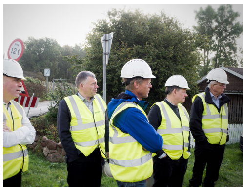
Sænkning af spor under bro på jernbanen Køge Nord - Næstved

Statsrevisorerne noterede sig, at principperne i ny anlægsbudgettering muliggør større budgetsikkerhed og kvalitet i beslutningsgrundlaget for store anlægsprojekter, men også medfører en risiko for