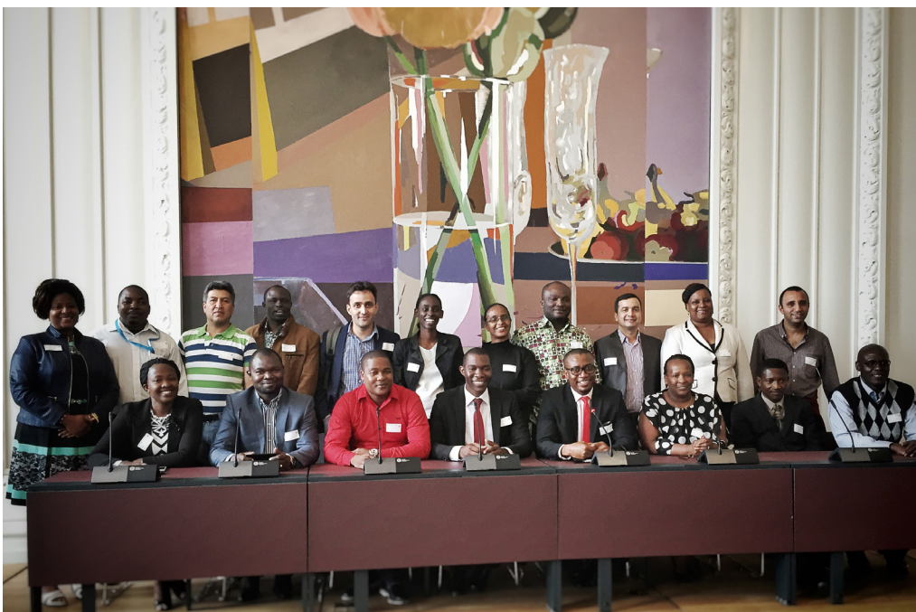
Et hold fra Danida Fellowship Centre stiller op til gruppebillede i Landstingssalen

Statsrevisorerne konstaterede, at Folketinget i højre grad kan benytte revisionens resultater i den parlamentariske kontrol og i det fremadrettede lovgivningsarbejde. Spørgs-