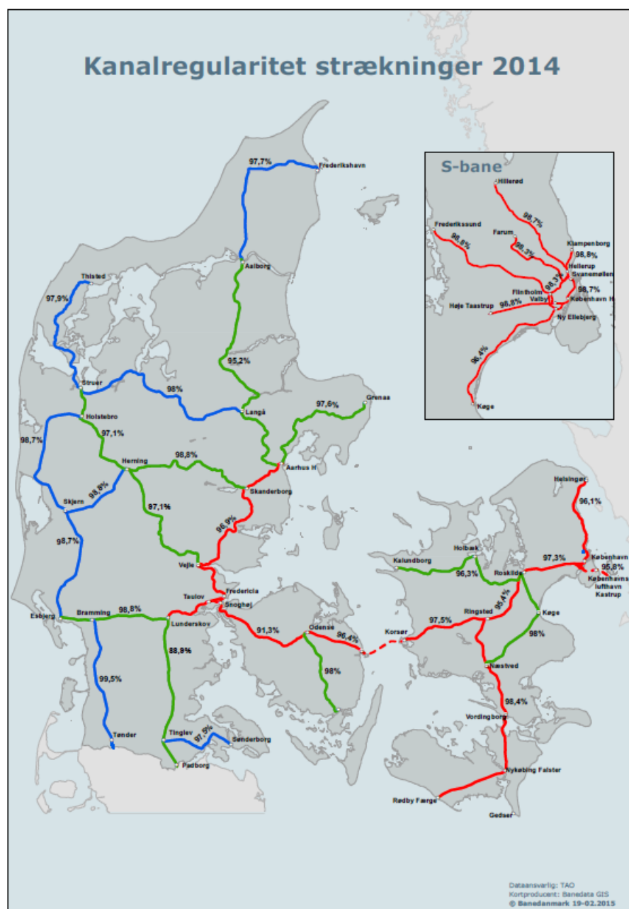
Figur 3: Strækningsvis kanalregularitet 2014

Trods det overordnede, gode årsresultat har den strækningsvis kanalregularitet på nogle strækninger været under det forventede. Det drejer sig om følgende strækninger på fjernbanen: