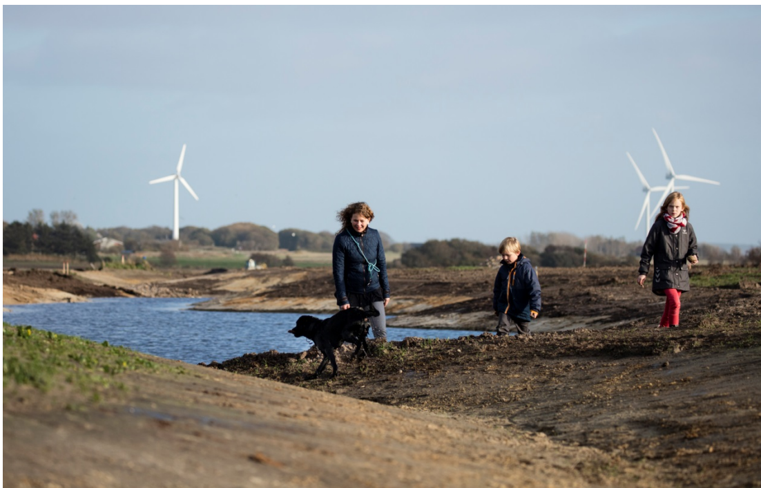
Figur 11. I Ringkøbing K er der ingen planer om at bruge medfinansieringsbekendtgørelsen. Den opfattes som et alt for bureaukratisk værktøj. Området bliver allerede brugt rekreativt her i anlægsfasen.

Dernæst kommer spørgsmålet om drift af anlæggene. Som udgangspunkt er det bygherren, der skal stå for driften, men de omkostninger, der vedrører den vandtekniske del, kan forsyningerne betale. Igen skal man afgøre, hvad der er hvad. Det er også mest praktisk, hvis de samme driftsenheder kan drifte hele anlægget, og der ikke skal forskellige personer ud til de samme anlæg. Men det kræver, at kompetencerne til hele driftsdelen er til stede i den pågældende driftsenhed. Når kommunerne eller andre private bygherrer står for driften, er det også vigtigt for forsyningsselskaberne, at man har kontrolmekanismer, så man er sikker på, at den hydrauliske funktion fungerer. Eftersom man ikke har mange erfaringer med anlæggene, er det desuden svært at forudsige nøjagtigt, hvad driften kommer til at koste. Men man skal alligevel give et bud, da det skal med i ansøgningen om tillæg til prisloftet på spildevandstakterne. Dernæst kommer de praktiske hensyn til, hvordan man fastholder viden om anlæggenes tekniske funktion og sikrer den langsigtede funktionalitet som nævnt i afsnittet om teknisk læring, s. 27.