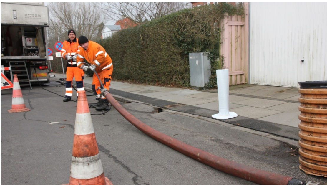
Figur 5. Forsyningerne forholder sig til de forventede klimaændringer i deres almindelige vedligeholdelsesarbejde på ledningsnettet. Her er medarbejdere fra Frederiksberg Forsyning i gang med vedligeholdelsesarbejde.

somhed på andre måder. Og medarbejderne fra andre områder har i forvejen mange ting at forholde sig til.