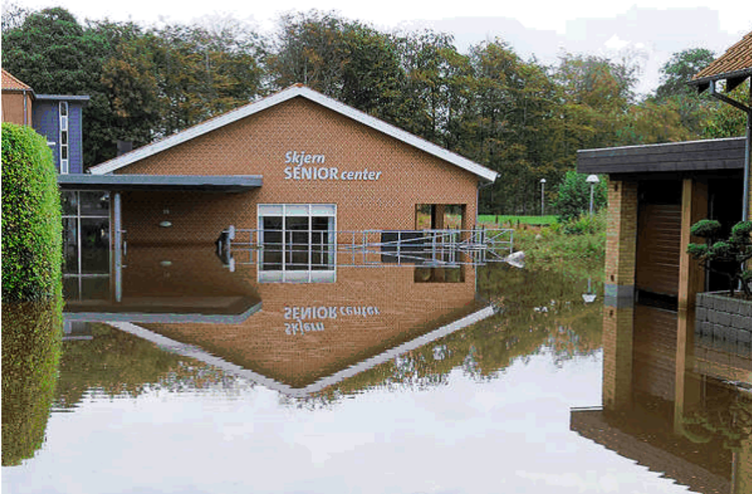
Figur 4. Under skybruddet i Skjern i september 2014 blev blandt andet det kommunale seniorcenter oversvømmet. Da centeret ligger uhensigtsmæssigt, er det siden besluttet at rive det ned og lave et regnvandsbassin i området.

Men det er ikke kun det rørslagne vand, der kan mangle viden om. Det kan også være vanskeligt at vide helt præcist, hvilke områder der er i fare, når skybruddene rammer, særligt når landskabet er fladt. I Ringkøbing-Skjern Kommune bliver det faktisk anset som den største udfordring for arbejdet. Den kommunale medarbejder fortæller: