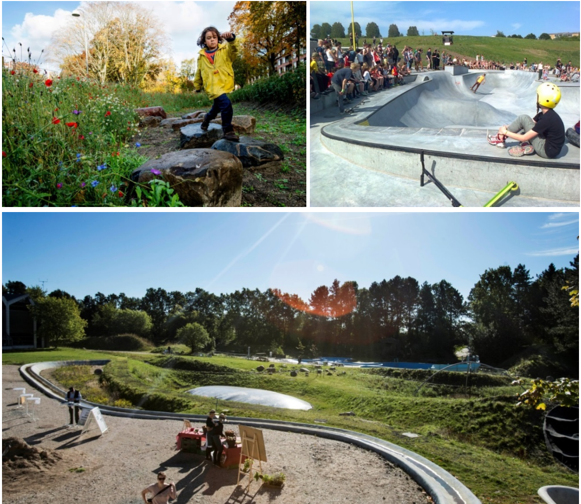
Figur 7. Øverst til venstre: Et eksempel fra Frederiksberg, hvor en grøft også kan bruges til både leg, bevægelse og ny natur. Foto: Carsten Ingemann. Øverst til højre: Nok et af landets mest berømte multifunktionelle regnvandsbassiner i Rabalderparken, Roskilde. Foto stillet til rådighed af Lone Plovstrup. Nederst: Kombineret regnvandshåndtering og leg ved Gladsaxe Stadion, hvor fx et regnvandsbassin i tørre perioder også kan bruges som hoppepude. Foto: Carsten Ingemann

Andre steder arbejder man med at opholde vandet i det åbne land (Aalborg, Aarhus, Ringkøbing-Skjern), før vandløbene støver op inde i de bebyggede områder. Her ligger det nye i de aftaler om erstatning, der skal indgås med landmændene.