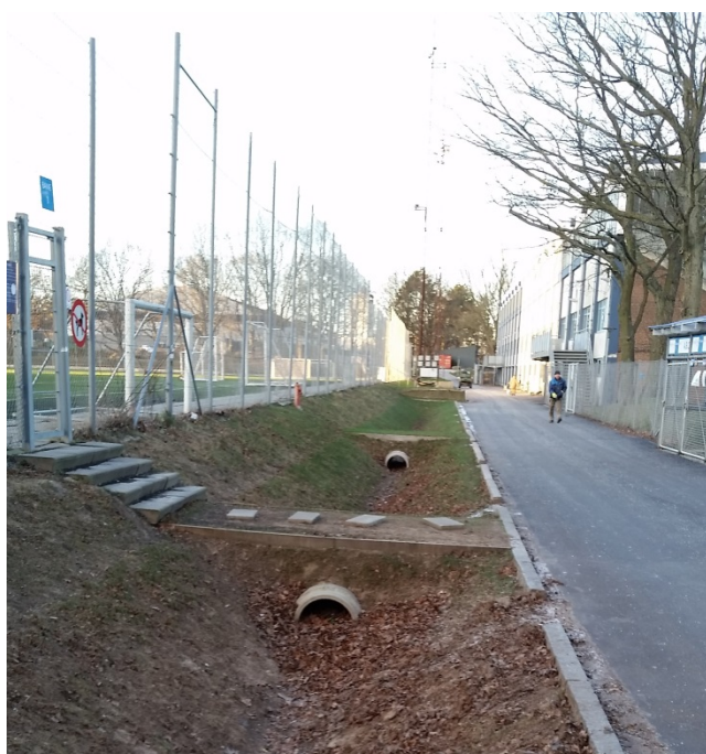
Figur 2. Hvis et anlæg som dette skal finansieres via medfinansieringsbekendtgørelsen, skal man bl.a. kunne angive, hvor stor en del af det, som er vandteknisk, og hvor meget der er rekreativt.

Desuden skal der medsendes en kort beskrivelse og et økonomisk overslag for den billigst mulige traditionelle løsning med samme serviceniveau som det projekt, der søges om. Overslaget skal være fordelt på omkostninger til investeringer, drift og vedligeholdelse. Desuden skal projektet holde sig inden for reglerne om tilknyttede aktiviteter (Miljøministeriet 2014). Der er én årlig frist for ansøgninger om en hævelse af takterne, som er den 15. april, i 2016 dog den 15. maj (Konkurrence- og Forbrugerstyrelsen 2016).