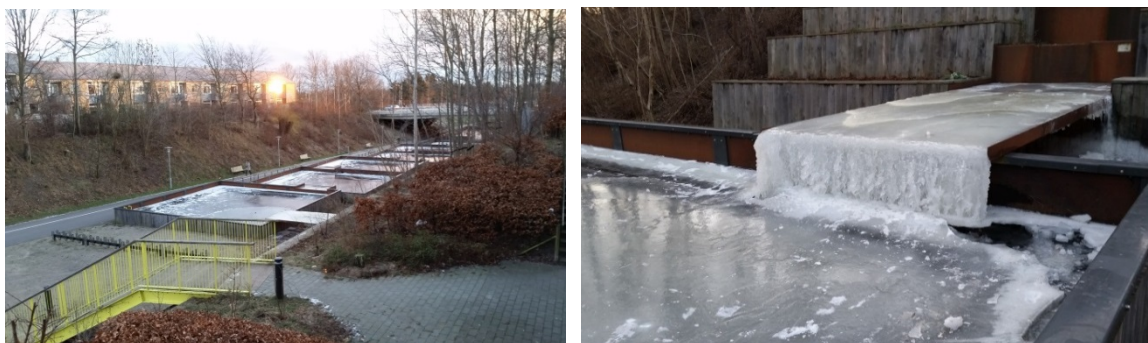
Figur 8. Om vinteren kan der være særlige udfordringer med overfladehåndtering af regnvand. Her et isdækket anlæg i Gladsaxe Kommune.

Når man går i gang med anlæggene, viser der sig også en række praktiske forhold, man skal tage højde for. En af dem er glatførebekæmpelse. Mange af projekterne håndterer regnvand på overfladen og leder vandet videre til vandløb, søer, fjorde eller vådområ-