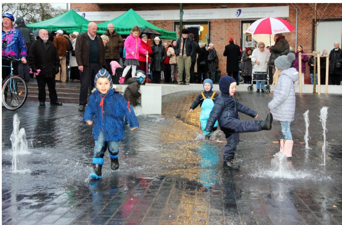
Figur 15. Det er borgerne, der skal bruge og leve med og i projektområderne. Derfor er det vigtigt at inddrage dem i processen. Inddragelsen kan give projekterne et løft og tilvejebringe vigtig viden.

Da klimatilpasningsplanerne blev lavet, var der ikke noget stort fokus på borgerinddragelse (Lund 2013), men det har ændret sig i implementeringen. I flere af projekterne er der lavet en ganske omfattende inddragelse.