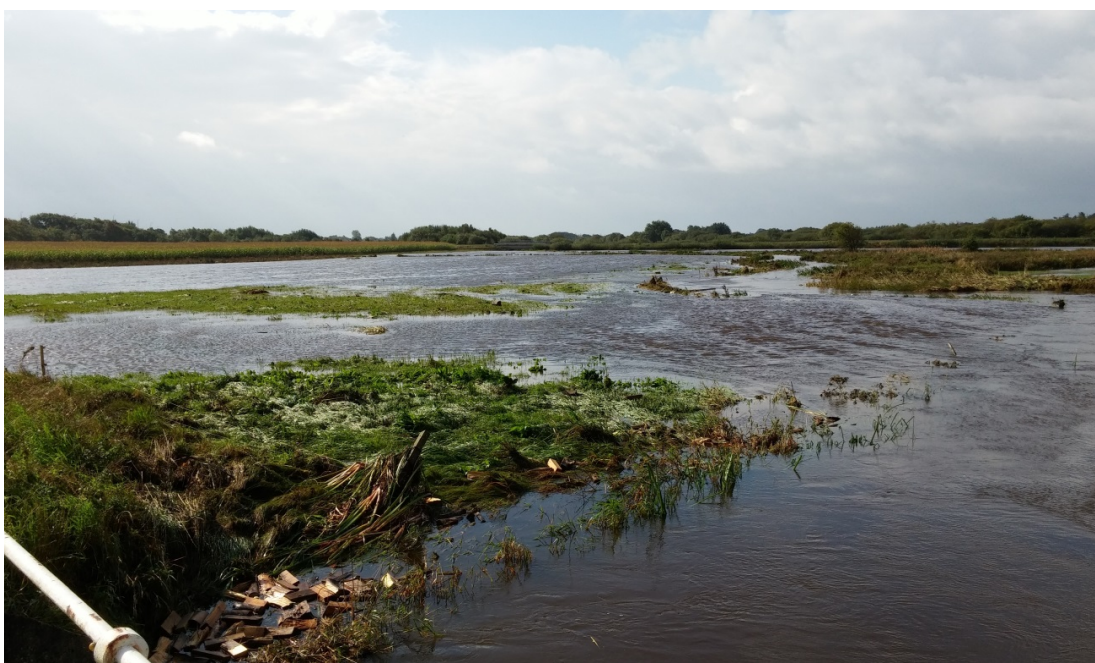
Figur 3. Her ses et vandløb i Ringkøbing-Skjern Kommune under skybrud.

Fødevareministeriet 2015c; Miljøministeriet 2013). I den forbindelse kan øget nedbør være et problem både i forhold til øget udvaskning af næringssalte og hyppigere overløb fra spildevandsanlæg. En øget vandstrømning (hydraulisk belastning) kan også forringe den økologiske tilstand i sig selv. De to lovgivninger kan derfor være svære at leve op til samtidig, medmindre der laves tiltag, som mindsker presset på vandløbenes vandføringskapacitet. Sådanne tiltag kan for eksempel være en del af de risikostyringsplaner for oversvømmelsesrisikoen fra vandløb og søer, som kommunerne også skal lave, og som forholder sig til forebyggelse, beredskab og sikring af værdier mod oversvømmelser. En del af dette kan være at sikre muligheder for kontrolleret overløb til vådområder med mere (Miljø- og Fødevareministeriet 2015b). Der er altså gode muligheder for at udføre klimatilpasningstiltag inden for de forskellige love og regler, men der er mange love og regler, man skal forholde sig til, og som kræver, at forskellige planer bliver koordineret.