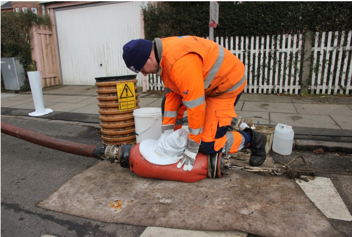
Figur 10. Der er ikke så meget tvivl om, om en kloakledning er et teknisk anlæg. Det kan der være, når der er tale om en grøft, som bruges til regnvandsafledning.

Et konkret eksempel på, at ansvarsfordeling kan skabe uklarhed, er spørgsmålet om et vandløbs status. En kommune kan i nogle tilfælde omdefinere, hvad der hidtil har haft status af et vandløb, til et teknisk anlæg, når en forsyning begynder at lede regnvand til det som en del af en overfladehåndtering. En forsyningsrepræsentant siger: