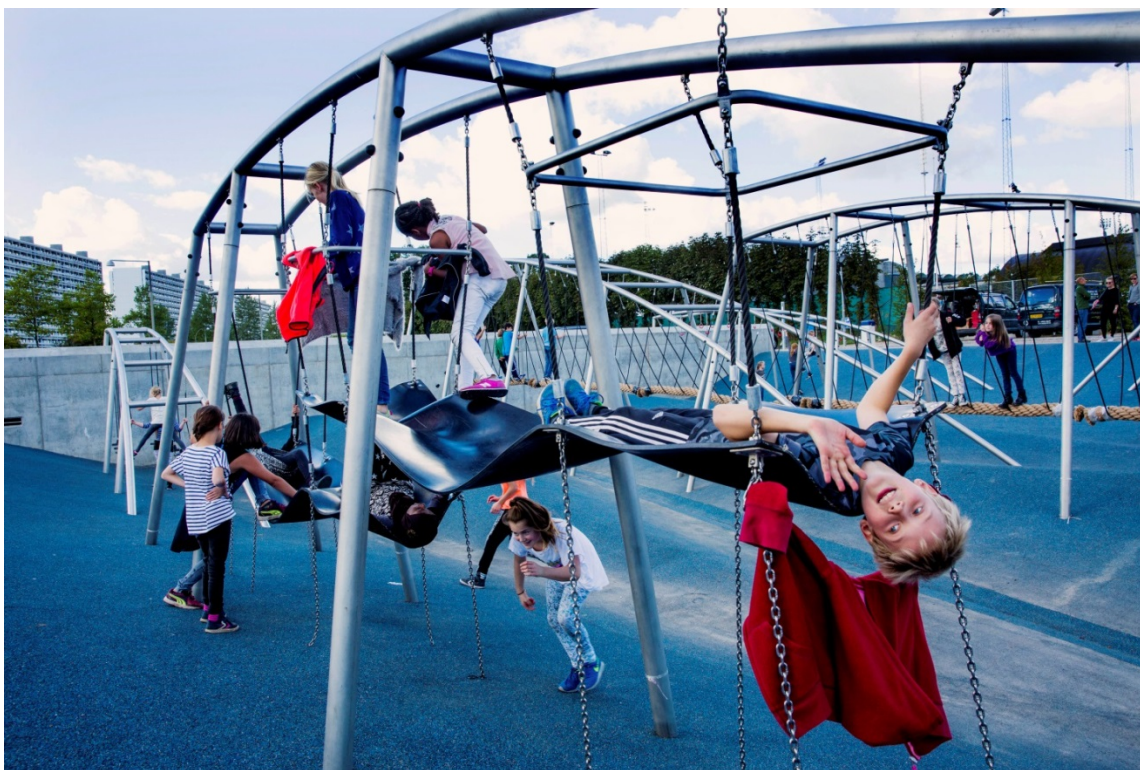
Figur 13. Her ses en del af resultatet fra Vandplus-projektet i Gladsaxe. Et sådant projekt ville ikke kunne laves uden et godt samarbejde mellem kommune, forsyningsselskab og idrætsforeninger.

res med så meget andet, fx vejrenoveringer eller skolegårdsrenoveringer i kommunen og med forsyningsselskabernes almindelig vedligeholdelses- og renoveringsarbejde. Det kræver som minimum, at begge parter er orienterede om, hvad der foregår hos den anden part. Et godt samarbejde og en god dialog er også særligt vigtigt, når man når til de diskussioner, der er affødt af en uklar lovgivning. Se forrige afsnit.