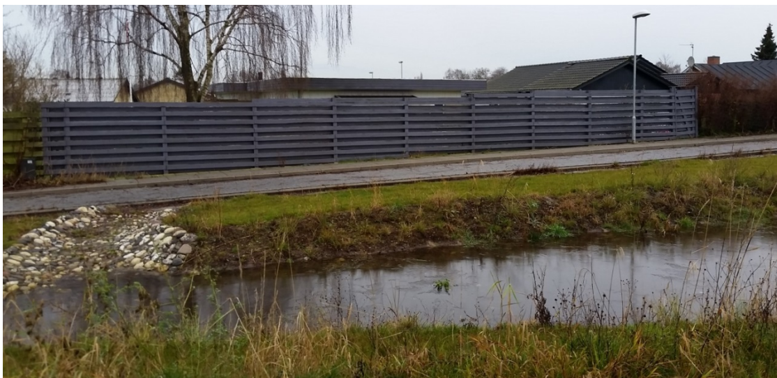
Figur 9. Bassinet i Lystrup får vand via overfladeløsninger, som ikke alle er så tydelige i landskabet som her på billedet, og hvor der ikke skal mange ændringer til, før funktionaliteten trues. Hvordan sikrer man den langsigtede funktionalitet af overfladeanlæggene?

projekt undervejs. Også lavpraktiske hensyn til driften af arealer spiller ind. Det skal være muligt at bruge de maskiner, man har, og det skal være muligt for en person at løfte dæksler m.v. Det har betydning for udformningen af anlæggene og materialevalg i enkeltelementer. Eksemplerne viser, at der er mange hensyn, man skal huske at tage højde for i projekteringen, og at man alligevel skal forberede sig på at være fleksibel og have en buffer i økonomi og tidsplan til uforudsete problemer i anlægsfasen.