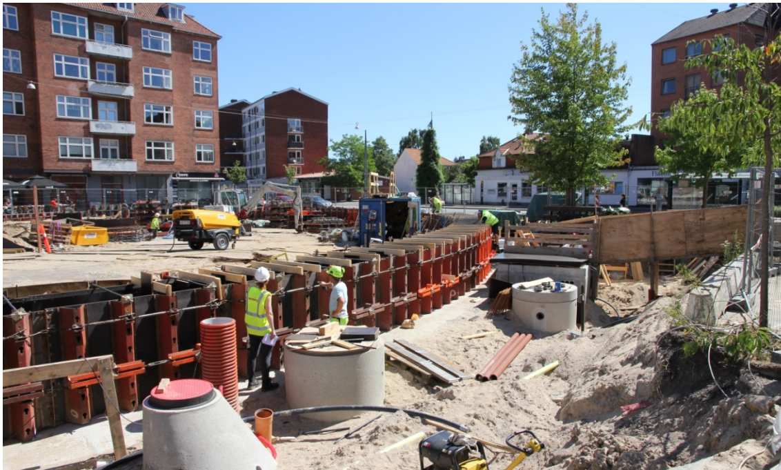
Figur 12. I samarbejdsaftalerne kan der opstå tvivl om, hvor stor en del af anlægget, der er en del af den hydrauliske funktion. Det har stor betydning for både fordelingen af investerings- og driftsomkostninger.

har et pålæg fra kommunen. Et pålæg skal både behandles i det kommunale system og i forsyningsselskabernes bestyrelser, og så skal det anmeldes til forsyningssekretariatet inden april. Det kan tage over et år at få vedtaget. Hvis man allerede er i gang med anlægget, kan man ikke lade projektet ligge så længe.