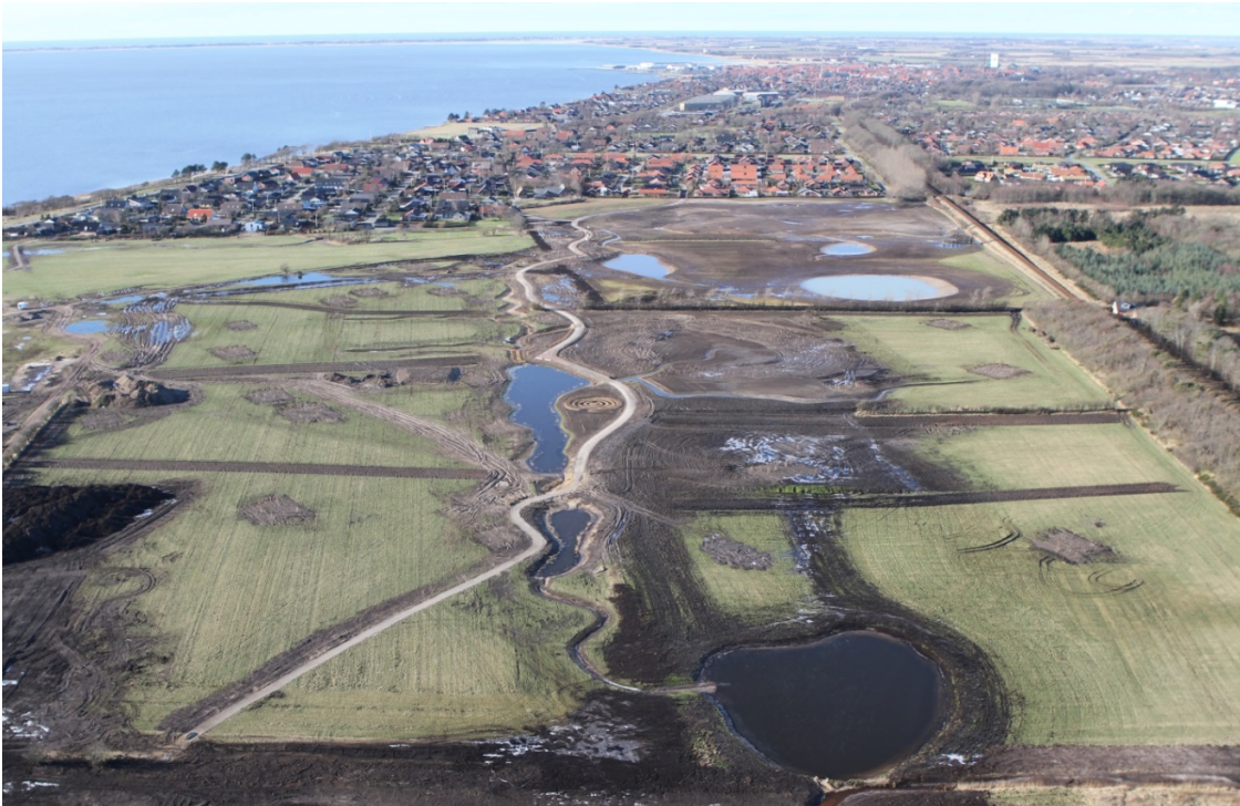
Figur 6. Gravemaskinerne er i færd med at færdiggøre infrastrukturen til regnvandshåndtering i byudviklingsprojektet Ringkøbing K. Projektet indeholder regnvandssøer og vandløb, og terrænet bliver hævet, hvor der skal bygges huse. Området forventes at få stor naturværdi og stor rekreativ værdi for Ringkøbings borgere. Se mere om projektet på www.ringkoebingk.dk .

Der er altså stor forskel på karakteren af de projekter, som sættes i gang. Men både for kommuner og forsyninger er der og har der været læring i de første anlægsprojekter, fordi de indeholder mange nye elementer, involverer ny lovgivning og nye samarbejdsformer. Det nye både for forsyningsselskaberne og for kommunerne er, at projekterne skal være multifunktionelle.