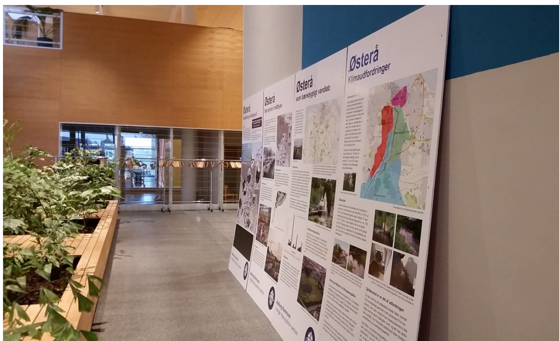
Figur 14. I Aalborg Kommune bliver der informeret om projekter ved hovedindgangen. Det er en af mange måder at gøre opmærksom på klimatilpasningsindsatsen på.

”Klimatilpasning er en opgave, der har ligget et udefinerbart sted i flere år. Alene det at finde ud af, hvor den hører hjemme i en kommune, er svært. Da der skulle laves en klimatilpasningsplan, blev der dannet en projektgruppe, og den gruppe havde sådan set ikke noget organisatorisk ophæng. Men det gode var, at gruppen var tværgående nedsat. Stille og roligt kom opgaven til at bo mere og mere hos miljøområdet. Der ligger den nu, og der ligger den godt. Og så er der jo mange snitflader med andre opgaver stadigvæk.”