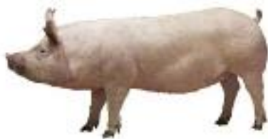
DanAvl Yorkshire (YY)