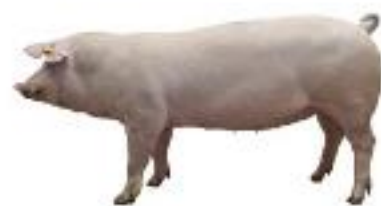
DanAvl Landrace (LL)