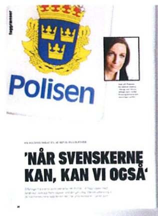
Artikel fra HK STAT Bladet om studiebesøg hos Svensk Politi

Vi vil gerne opfordre til, at der arbejdes videre med anbefalingerne i politianalyserne. Det skaber ikke alene fleksibilitet i alarmcentralernes opgaveløsning. Det bidrager også til at frigøre flere politibetjente til andre opgaver.