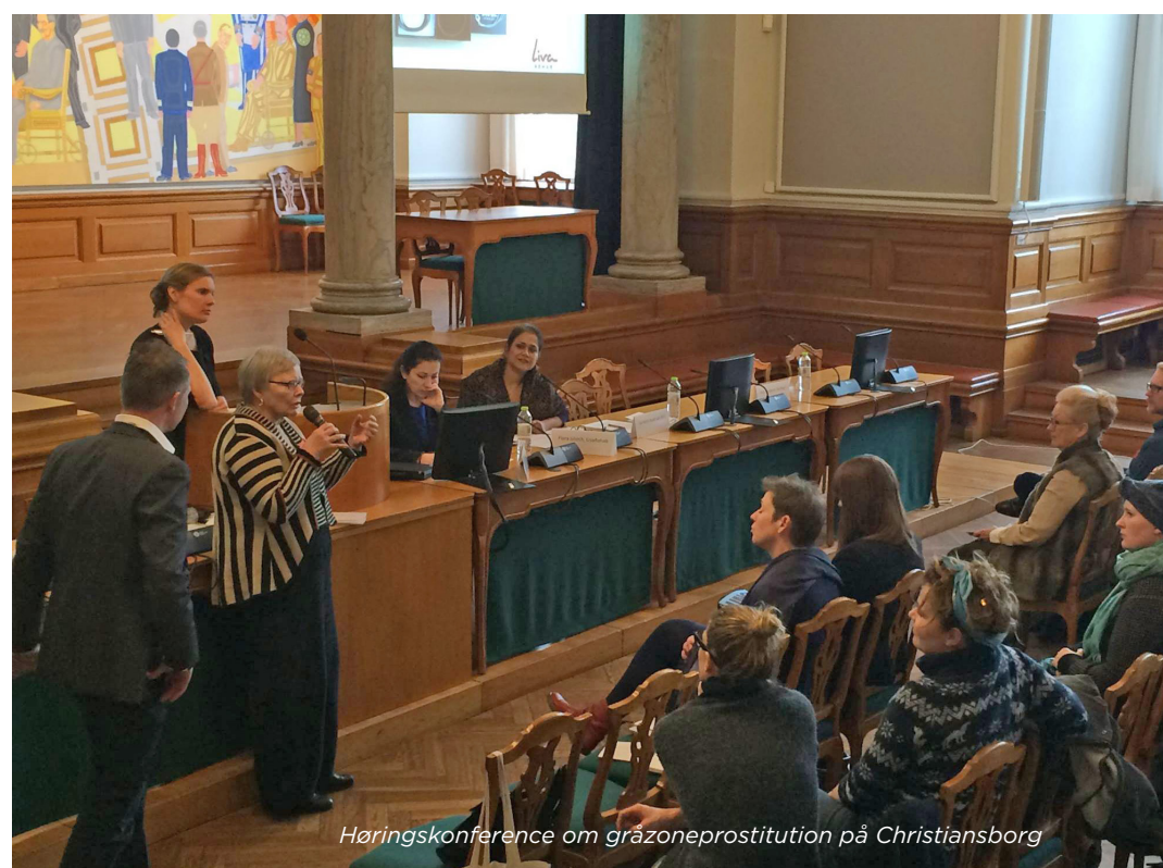
Høringskonference om gråzoneprostitution på Christiansborg