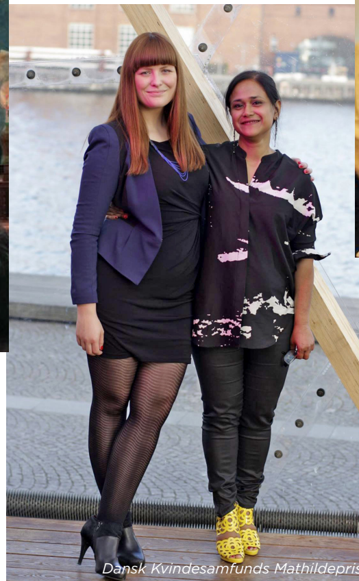
Dansk Kvindesamfunds Mathildepris