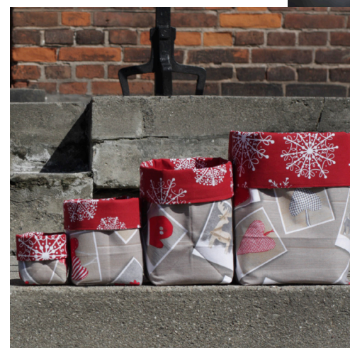
LivaCreation, håndknyttede armbånd med Liva charms fra Pilgrim og stofkurve fra LivaCreation christmas collection.