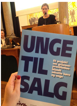
Evalueringssrapport 'Unge til salg? Et projekt om gråzoneprostitution blandt udsatte børn og unge'