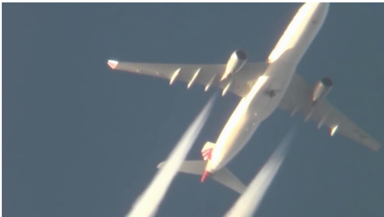
Foto: Chemtrails-fly: Dette foto er fra samme hollandske kilde som ovenstående foto af et Emirates-fly.